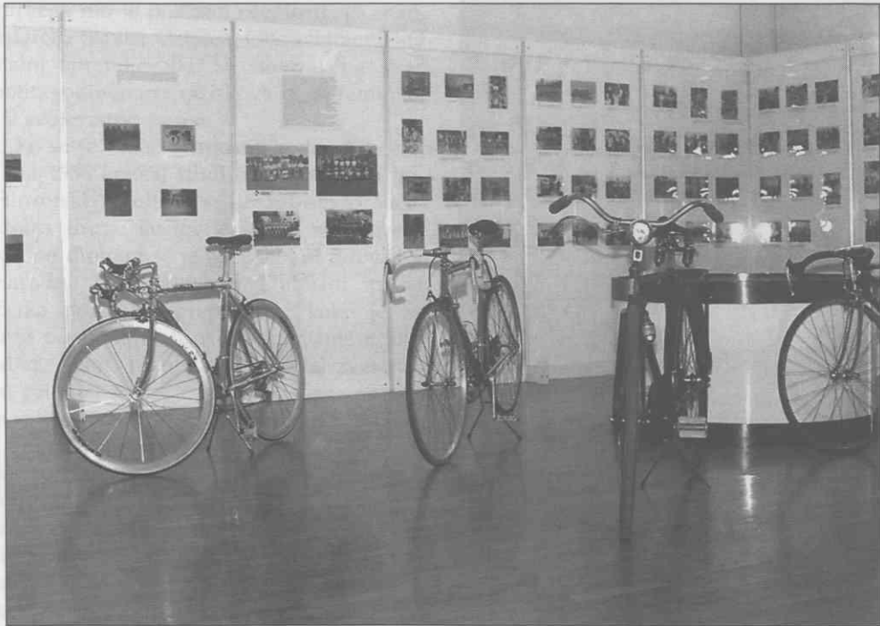
Razstava Sto let kolesarstva v Novem mestu v Dolenjskem muzeju, 1997.