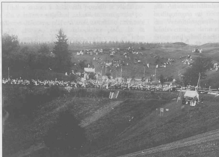
Veselica Kluba dolenskih biciklistov na Marofu, 1899.