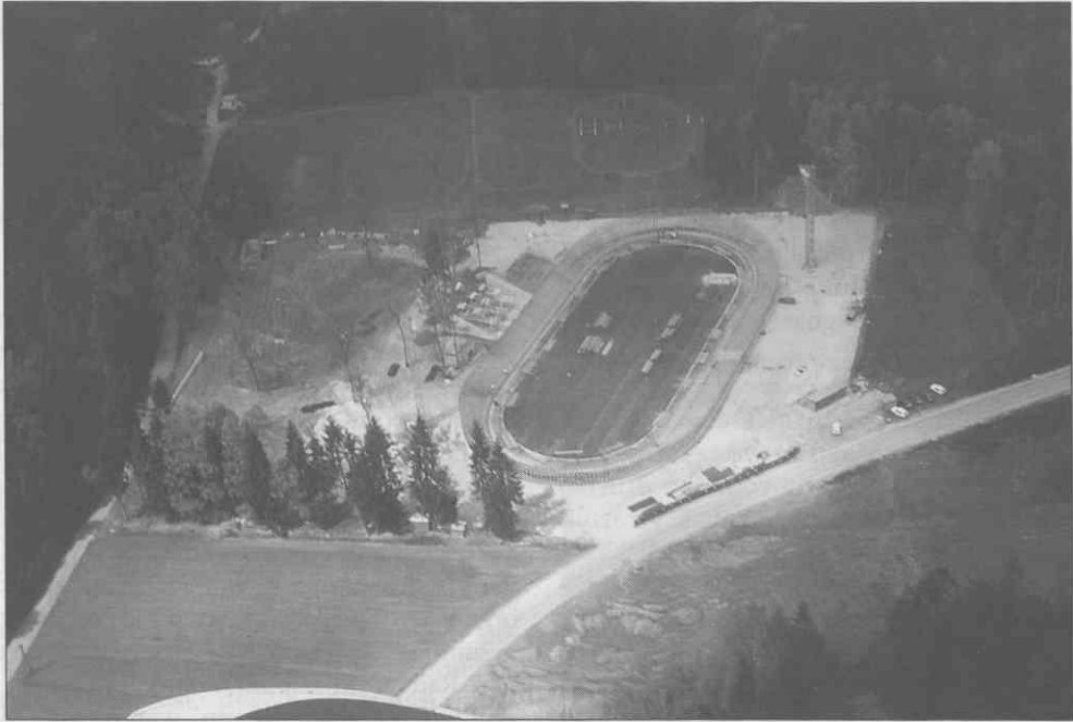
Velodrom je začel dobivati končno podobo, 1996.