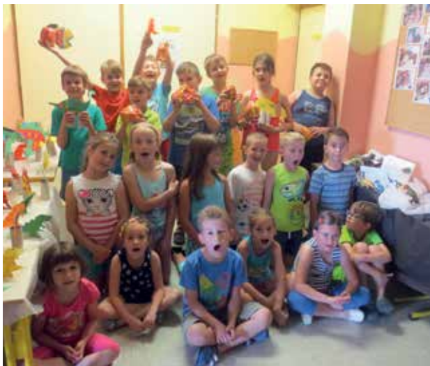
Slika 1: Udeleženci počitniških ustvarjalnic 2015/2016 – Igrajmo se zgodbo »V pradavnini«.

Počitniške ustvarjalnice so zasnovane tako, da učence skozi vse dejavnosti vodi zgodba, zato smo jih v podnaslovu poimenovali Igrajmo se zgodbo. Odločili smo se, da bomo vsako leto izhajali iz drugačne teme, ki se bo nanašala na vsakdanje življenjske situacije. Na vsako temo smo pripravili različne dejavnosti s področja književnosti, likovne umetnosti, tehnične vzgoje, lutkovno-dramskega ustvarjanja, glasbe, plesa, naravoslovja, kulinarike in športa.