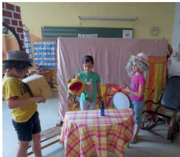
Slika 9: Zaključna prireditev za starše počitniških ustvarjalnic 2013/14, Igrajmo se zgodbo Žogica Nogica.

Ob zaključku ustvarjalnic vsako leto za starše pripravimo predstavo, in to kot mozaik vsega, kar so učenci doživeli in ustvarili. Učenci prejmejo tudi zloženko z utrinki doživetij in vseh znanj, pridobljenih na delavnicah. Prvo leto so učenci staršem zaigrali predstavo Žogica Nogica, naslednje leto pripravili cirkuško predstavo s povabilom, da se jim v cirkusu pridružijo še starši in se preizkusijo v različnih spretnostih. Nato so staršem predstavili »Pradeželo« s pesmijo, plesom in razstavo različnih likovnih izdelkov. Nazadnje pa so starše seznanili z jogo za možgane, ustvarili kratki kulturni program s plesom, petjem in predstavitvijo znanj, ki so jih pridobili o možganih.