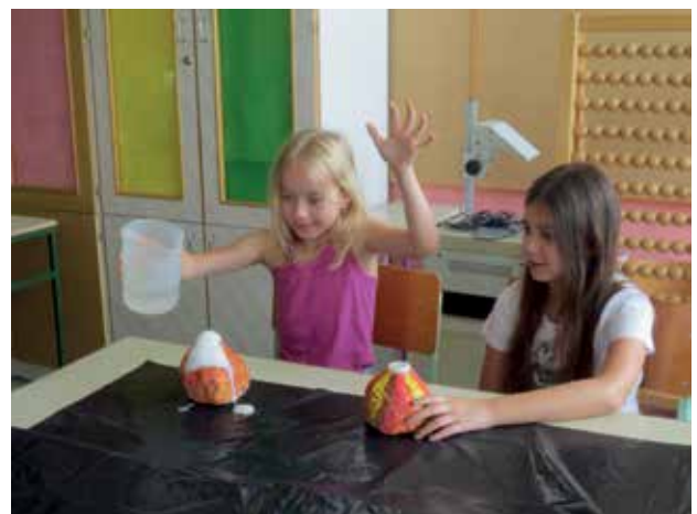
Slika 8: Naravoslovna ustvarjalnica, preizkušanje delovanja vulkana.