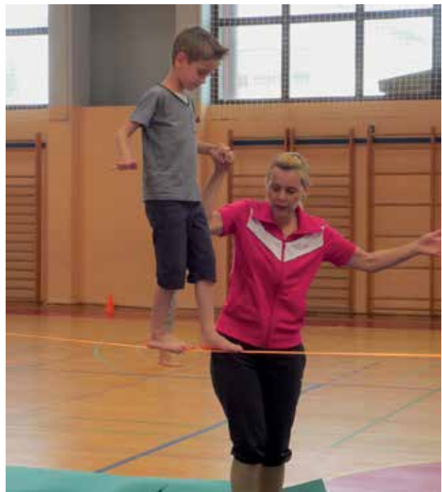
Slika 3: Športna aktivnost – hoja po vrvi.