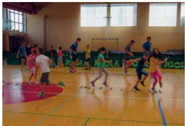
Slika 2: Športna aktivnost v sodelovanju s KNZ Murska Sobota.

Potek delavnic smo omejili na največ eno šolsko uro, potem sledijo vodene športne aktivnosti in spet bolj umirjene dejavnosti. Takšen način izvajanja dejavnosti je po naših izkušnjah najbolj primeren pristop za to starostno stopnjo učencev.