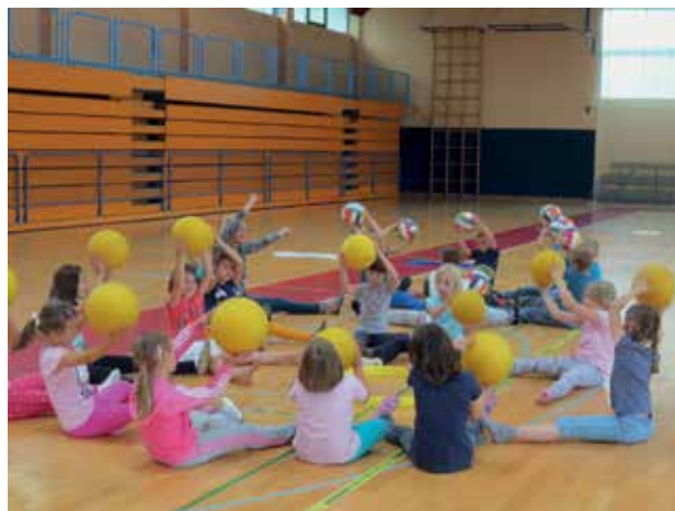
Slika 4: Plesna ustvarjalnica, ples z žogami.