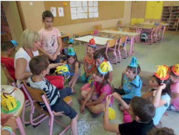
Slika 5: Likovna ustvarjalnica, oblikovanje kostumov za igro vživljanja v klovne.

Naslednje leto »smo se igrali zgodbo« Cirkus. Književna junakinja pisatelja Otfrieda Preusslerja, klovnesa, nerodna Avgušтина, je učence popeljala skozi dejavnosti spoznavanja cirkuškega življenja. Telovadnica šole se je spremenila v cirkuško areno, v kateri so urili marsikatero cirkuško spretnost, kot je hoja po vrvi, žongliranje ... Večino rekvizitov, ki so jih uporabili, so učenci izdelali sami. Oblikovali so žoge za žongliranje, ustvarjali cirkuško glasbo z malimi Orffovimi instrumenti in ustvarili cirkuško predstavo s klovni.