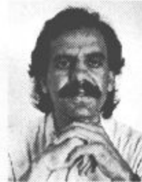
Piše: Jože Krajnc

Edina zamrznjena stvar, ki greje, so plače. Ali pa vsaj ena redkih oziroma tistih, ki kljub temu, da so na ledu, najbolj pogrejejo. Tako je bilo, ko so nam jih zamrzovali starežimski mojstri tovrstnega početja, tako je dandanašnji, ko nam jih v to agregatno stanje skušajo ujeti poznavalci tržnogospodarskih zdravilnih kur. Če je kdo mislil, da bi lahko bilo drugače, se je pač zmotil. Nvsezadnje je popolnoma vseeno, ali tistemu, kar po dolgem mesecu dobimo, rečemo osebni dohodek ali plača. Denar je denar in ko nam oblast administrativno zalepi kuverte, je kri hitro vroča. Taki smo, taki bomo ostali, zato še svež vladni ukrep doživlja odmeve, kakršne doživlja.