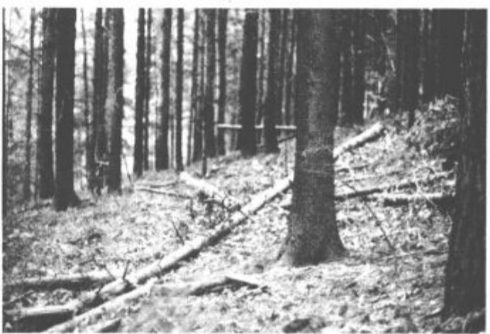
Nekaj takega je pravi raj za lubadarja

To lahko opravijo lastniki sami, seveda pa ni nikoli odveč posvet z revirnim gozdarjem. Opraviti je treba tudi higienske sečnje, torej posekati oslabela, polomljena in drugače poškodovana drevesa, ki so prva tarča napada lubadarja. Seveda je treba takoj vzpostaviti popoln gozdni red, gozdarji pa v tem času posebej pripravljajo ustavitve sečnje zdravih dreves, ki bodo