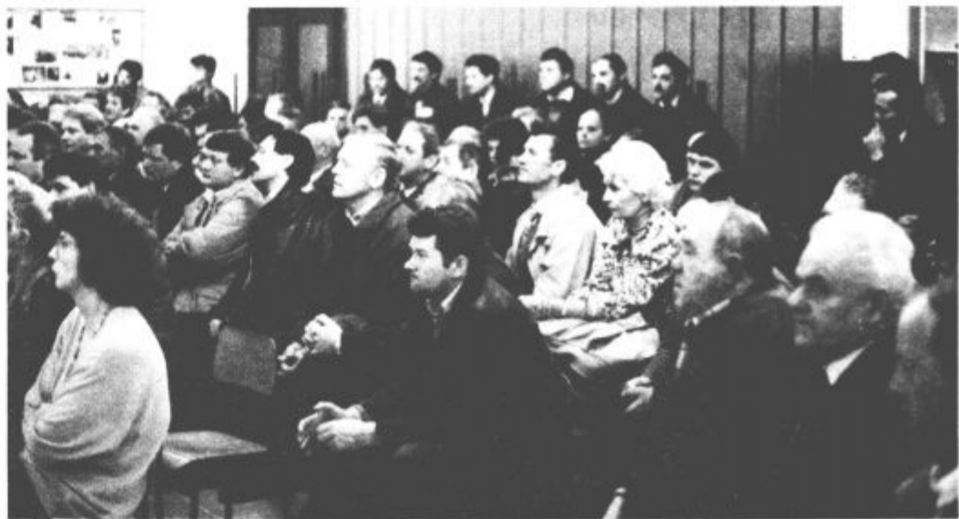
Nabito polna dvorana se je v trenutku izpraznila. Kaj sedaj?