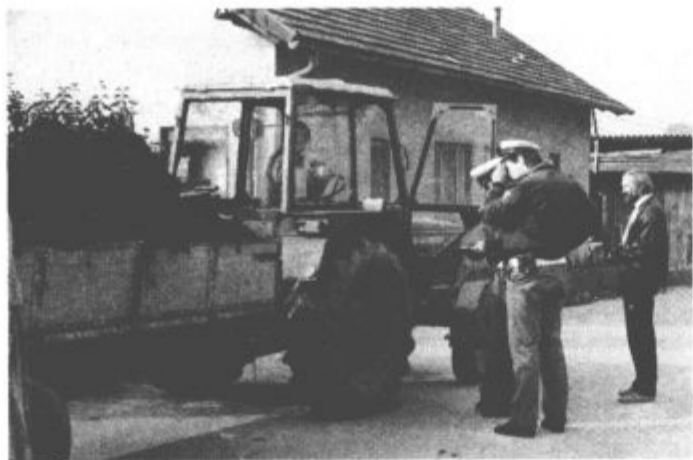
Tudi ti pridejo na vrsto

Republiški SPV za akcijo Mladinskega Ceha