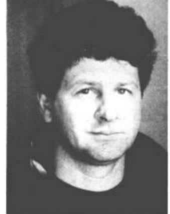
Tajnik Hasan Pašić