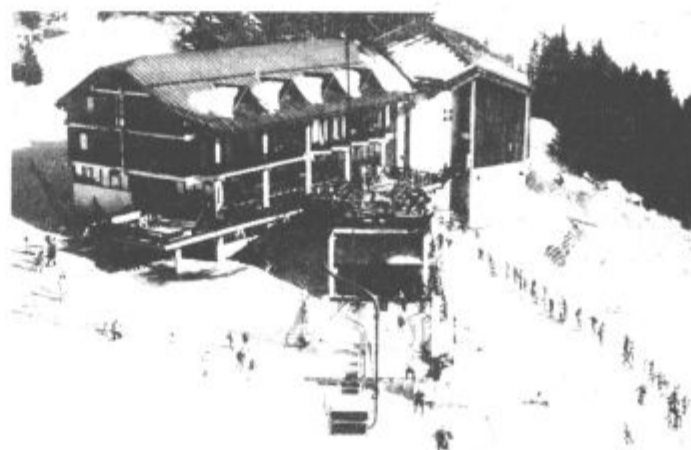
To so bile zime!