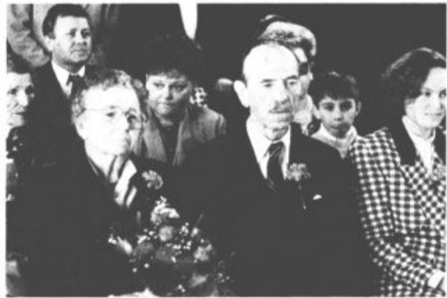
S slovesnosti v žalski poročni dvorani.