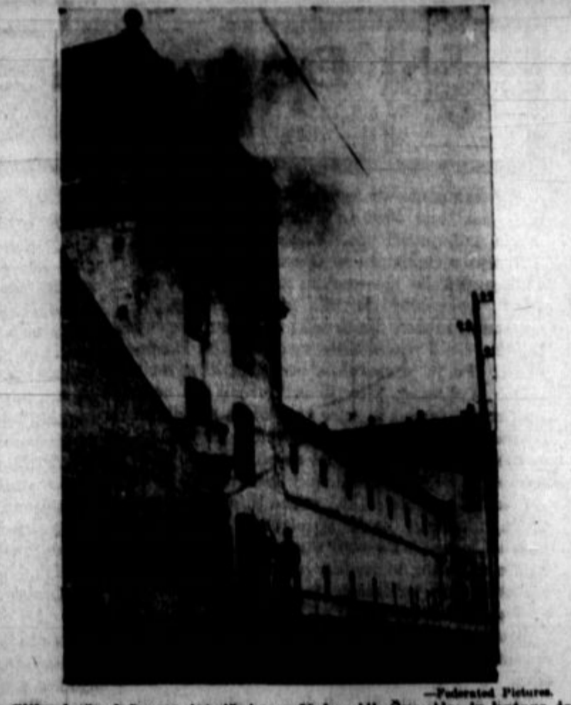
Slika kaže državno jetnišnico v Valenciji, Španija, iz katere je bilo nedavno izpuščenih veliko število političnih jetnikov.

Perica: "Tonček, zakaj pa ma- žeš vrata?" Tonček: "Da ne bodo škripa- la!" Perica: "Tonček, ali ne bi mo- gel tudi naše male punčke na- mazati?"