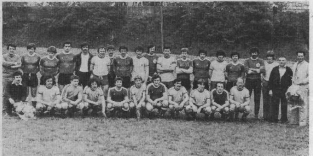
TRŽIČANCI NA ČRNUČAH – Mariljvi odborniki in igralci nogometnega kluba Črnuče so se spet izkazali. Organizirali so povratno srečanje z zamejskim klubom Gaja iz Padrič pri Trstu. Zmagali so domačini 4:3. Srečanje z zamejskimi Slovenci je bilo izredno prisrčno, tekma pa pravi užitek za 200 gledalcev. Na sliki: moštvi pred začetkom srečanja.