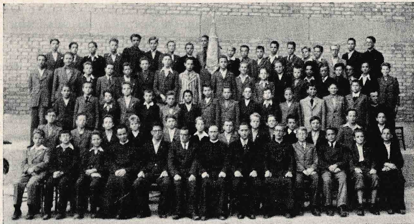
Dijaška Marijina kongregacija na Rakovniku ob koncu šol. leta 1943-44.

nam bistrijo pogled in kujejo značaj, z veseljem sprejemamo. Borba v življenju ni lahka. Silni so valovi zmot in strasti. Ti, Marija Pomočnica in zvezda naša, nam pomagaj, da bomo svoj čolnič varno privedli do obrežja večnosti. Blagoslovi naše delo, da bomo tudi mi mnogim rojakom zvezda vodnica k Tebi v nebo.“