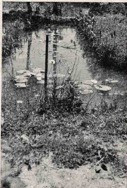
Tih kotiček v rakovniški okolici z jezercem in cvetočimi lokvanji.