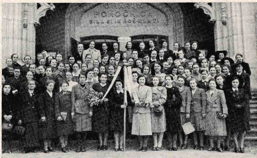
Franciščanska dekliška Marijina družba pri Mariji na Rakovniku

Človek bi mislil, da bo kot Aleksandrov prijatelj in evropsko vpliven mož postavljen za namestnika v poljskem kraljestvu. Toda ruski vpliv in zavist sta to preprečila. Czartoryski je