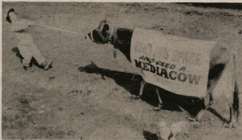
Kljub veliki prizadevnosti mladega farmerja, krava noče nič slišati, da bi se s transparentom na sebi premaknila, tako da ne more računati niti na podporo