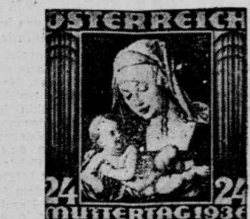
Avstrijska znamka za lanski »materinski dan«.

je, da še zmerom drži stari pregovor, da je bolezen laže preprečiti kakor ozdraviti.