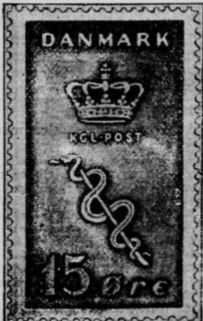
Danska znamka v korist fonda za pobljanje raka.

Kako je v tem pogledu drugje, v vaših naprednih državah, smo že pisali opetovano. Danes prinašamo samo nekaj slik tujih lepih znamk, ki jih imamo slučajno pri roki. S tem seveda še dolgo ni rečeno, da ni še lepših znamk. V teh državah je tudi prav zaradi lepih znamk filatelija dosti bolj razvita in poštna uprava proda dosti več znamk, ki jih kupijo ljubitelji teh malih umetnin. In dobček poštne uprave je še večji, ker se te znamke ne porabijo toliko na pismih, ampak gredo po večini nerabljene v albume zbiralcev. Koliko nanese izkupiček teh znamk, si od težavno izračunati. Vse grede v milijone, v milijone, ki bi jih tudi pri nas lahko zaslužili, če bi vodili nekoliko bolj pametno filatelistično politiko.