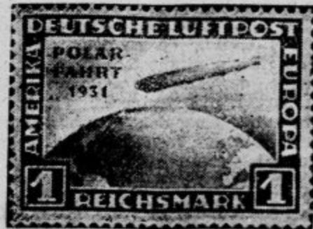
Nemška znamka v spomin na Zeppelinov polet čez Severni tečaj.

Toda do tega še nismo prišli. Res je, da poizkuša poštna uprava s pogostimi priložnostnimi znamkami pri filatelistih nekaj zaslužiti, ker filatelistom ne daje tega, kar bi morala, namreč lepih znamk, je njen