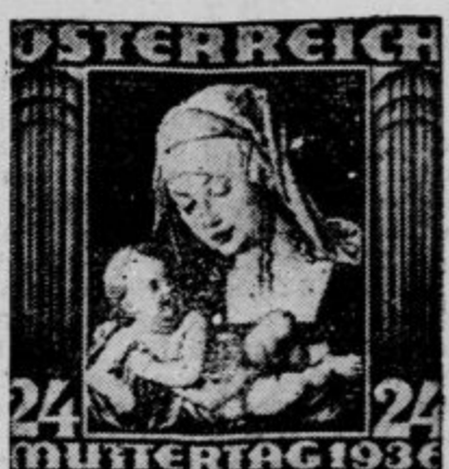
Avstrijska znamka za lanski »materinski dan«.

V tistih časih je pri nas precej zamrlo zanimanje za znamke in to se še zdaj ni prav izpremenilo. In kdo je temu kriv? Vprašanje puščamo odprto. Ugotavljamo