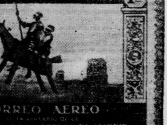
Znamka za spomin na obletnico španske novinarske zveze s sliko Dona Kkota.

je, da še zmerom drži stari pregovor, da je bolezen laže preprečiti kakor ozdraviti.