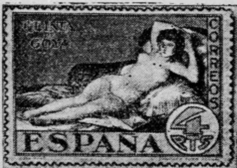
Španska znamka v spomin na slikarja Goyo. Kaže nam njegovo znano sliko »Gola Maja«.

Reklamo o novi markarnici poslušamo zdaj že dobro leto dni. Približno toliko časa kakor poročila o španski vojni, toda prav tako kakor v Španiji so vsa sporočila, reklamna in nereklamna, hudo megljena in nasprotujoča. Žal kakšnega izdelka, ki bi pričal o kakovosti novih strojev in novih strokovnjakov, žal še nismo imeli priložnosti videti in ga najbrž še ne bomo tako kmalu videli.