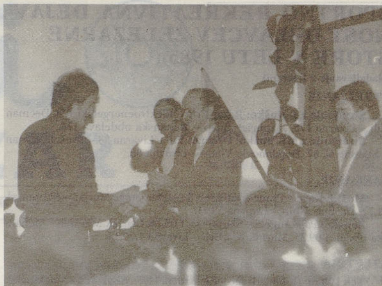
Predsednik KPO je podelil pokale in priznanja najboljšim.