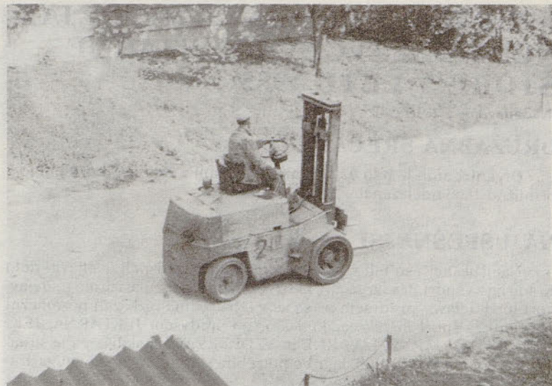
Ko zapade sneg, je vožnja z viličarjem po cesti veliko težja.

ka je v kratkem in strnjem prikazu pravnega varstva kupca pred stvarnimi napakami na kupljenih oz. prodanih stvareh.