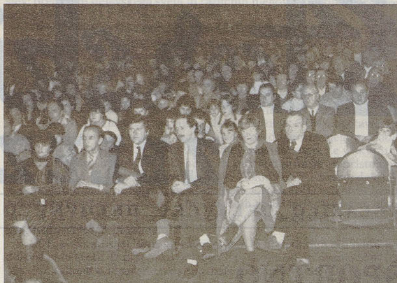
Štorska dvorana je bila polna.