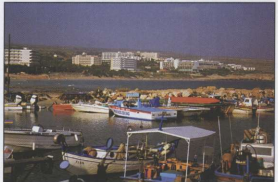
Slika 3: Novo obmorsko letovišče Ayia Napa ob jugovzhodni obali Cipra.