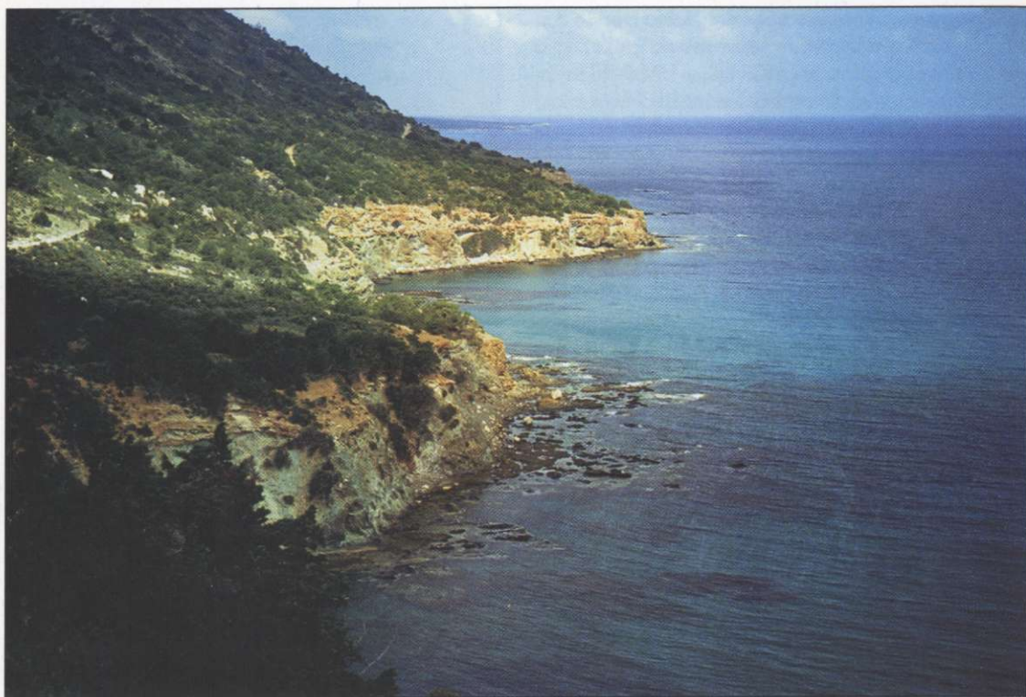
Slika 6: Skrajni zahodni rt otoka Cap Arnavitis še ni podlegel masovnemu turizmu.

vedno prisotnih 30.000 vojakov turške vojske. Poleg tega so se v izpraznjene grške vasi sistematično naseljevali priseljenci iz Anatolije, s čimer se ni spremenila le narodna sestava otoka, pač pa tudi identiteta oziroma mentaliteta ciprskih Turkov. O številu ni točnih podatkov, ocene se gibljejo med 60.000 in 80.000 (1). Tudi denarno je država odvisna od Turčije, saj je turška lira edina legalna valuta. Največji problem je gospodarska nerazvitost, čeprav je ob zasedbi ostala v turških rokah polovica gospodarskih potencialov otoka. Država sicer prejema pomoč Ankare v višini 80 milijonov USD na leto, kar omogoča vzdrževanje življenjske ravni le na stopnji Turčije. Letna inflacija je tudi do 60%. Gospodarstvo skoraj v celoti temelji na kmetijstvu, ves uvoz in izvoz pa potekata prek Turčije. Ker država ni mednarodno priznana, je pod gospodarskim embargom, ki ga uravnava južna sosedja. Letališča so zaprta za mednarodni promet. Hotelski kompleksi v okolici Kyrenie in Famaguste so od leta 1974 zapuščeni. V vseh pogledih je Turška republika Severni Ciper neke vrste čezmorska provinca Turčije z dvajsetlet-