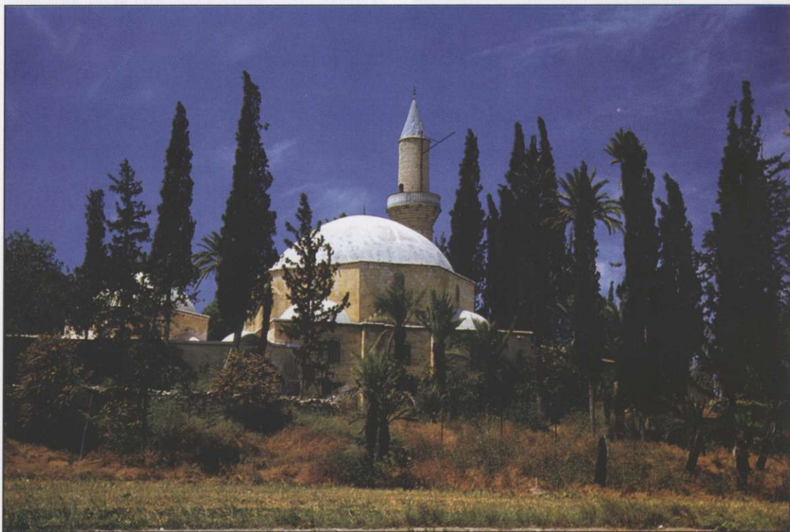
Slika 4: Mošeja Hala Tekke Sultan v bližini Larnace, do leta 1974 največje zbirališče muslimanskih romarjev na otoku.

Kljub sorazmernemu miru taka ozemeljska ureditev ni mogla dolgo trajati. Na pogajanjih je vsaka stran vztrajno zagovarjala svoje stališče glede ureditve države, Grki unitaristično, Turki federalistično.