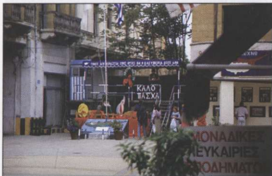
Slika 1: Ulica v središču Nikozije (grško Levkosia, turško Lefkosa) z demarkacijsko črto pod nadzorom modrih čelad OZN, ki deli ciprsko glavno mesto na grški in turški del. T. i. »zelena črta« je prehodna le za diplomate in pripadnike OZN.

ske ozemlje. S površino 9250 km 2 je za Sardinijo in Sicilijo tretji največji otok v Sredozemskem morju. Dolg je 240 km in širok 100 km. Leta 1994 je štel okrog 730.000 prebivalcev. Od severa proti jugu si sledi pet pokrajin. Prva med njimi je od 3 do 5 km široka obalna ravnica z glavnim mestom Kyrenia. Zaradi dobre namočenosti je to najbolj zelena pokrajina na otoku. Postopoma se dviguje v močno razjedeno kraško pogorje Pentadactylos. Sledi osrednja planota Mesaoria, kjer leži prestolnica Cipra, Nikozija. To je od 30 do 50 km široka dolina največje ciprske reke Pedios, pokrita z rodovitno kraško prstjo in intenzivno kmetijsko obdelana (žita, krompir, nasadi agrumov). Mesaoria se proti jugu dvigne v gorsko verigo vulkanskega izvora Troodos z najvišjim vrhom Olympus (1951 m n. m.). Pogorje je največji zbiralnik tekoče vode na otoku. Poraslo je pretežno z iglastim gozdom, med katerim srečamo endemično vrsto cedre in evkaliptus. Skrajni južni del otoka pripada z makijsko poraslemu kraškemu gričevju, kjer med kulturnimi rastlinami prevladujejo vinska trta, oljka in rožičev. Holocenska obalna ravnica je pokrita z obsežnimi nasadi agrumov in bananovih palm. Velik del obale je izkoriščen za turistične namene, saj ugodne temperature morja omogočajo turistom celoletno kopanje (srednja temperatura morja je januarja 16°C, avgusta pa 25°C). Peščene plaže se izmenjujejo z osamljenimi zalivi in skalnimi rti, med največja turistična središča pa sodijo Larnaca, Limassol in Paphos.