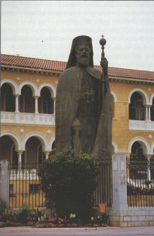
Slika 2: Spomenik nadškofu Makariosu (1913–1977), očetu neodvisnega Cipra in predsedniku države med letoma 1960 in 1974.

Zaradi lege na stičišču različnih kultur ter naravnih bogastev (rudniki bakra so dali otoku tudi ime), je bil Ciper v zgodovini plen velikih političnih sil, ki so na njem zapustile sledi v obliki bogate kulturne dediščine. Do leta 58 n. št. je bil Ciper del antične Grčije. Po priključitvi k rimskemu imperiju je bil podvržen pokristjanjevanju. Sledilo je obdobje Bizantinskega cesarstva v letih od 395 do 1191, ko je grško prebivalstvo sprejelo pravoslavno vero. V naslednjih tristo letih je bil Ciper svobodno katoliško kraljestvo pod vladavino francoskih križarjev. Iz tega obdobja so ohranjeni številni spomeniki gotske arhitekture. Nato je otok prešel pod upravo Beneške republike. Kot zadnja trdnjava krščanstva v Sredozemlju se je dolgo upiral otomanskemu ekspanzionizmu. Turki so se ga končno polastili leta 1571 in ostali na njem do leta 1878. To je bilo obdobje stagnacije, ko se je na otok priselilo 20.000 turških vojakov, njihovi potomci pa predstavljajo danes turško manjši-