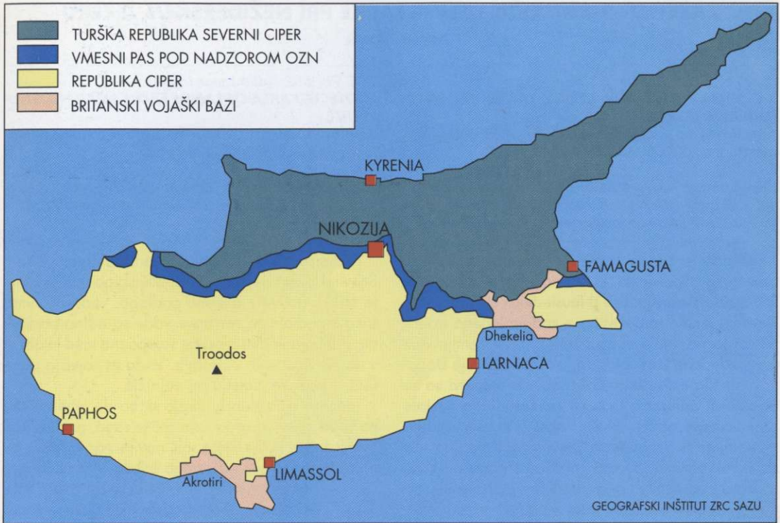
Slika 7: Ozemeljska razdelitev Cibra po letu 1974 (4).

razvito Republiko Ciper. Ciprski Turki predlagajo popolno federalizacijo otoka, kjer bi obe narodni skupnosti ostali razmejeni in imeli vsaka svojo vlado z maksimalno avtonomijo ter skupno zunanjo, obrambno in monetarno politiko. Po četrtem predlogu naj bi ostalo stanje tako kot je, odprli pa bi nekaj mejnih prehodov v današnji razmejivni coni.