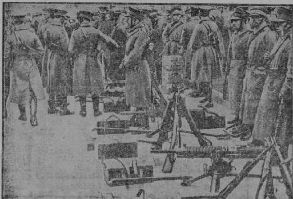
Revolucija v južnoameriški državi Čile. Strojnice na ulicah mesta Santiago.