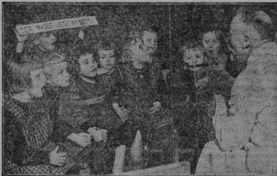
V Leipzigu na Nemškem so uvedli radio-oddajne naprave, ki omogočajo, da »sliši« gluhonema деца s tipanjem. Slika nam kaže gluhoneme otroke ne kot gledalce, ampak v ulogi »poslušalcev«.