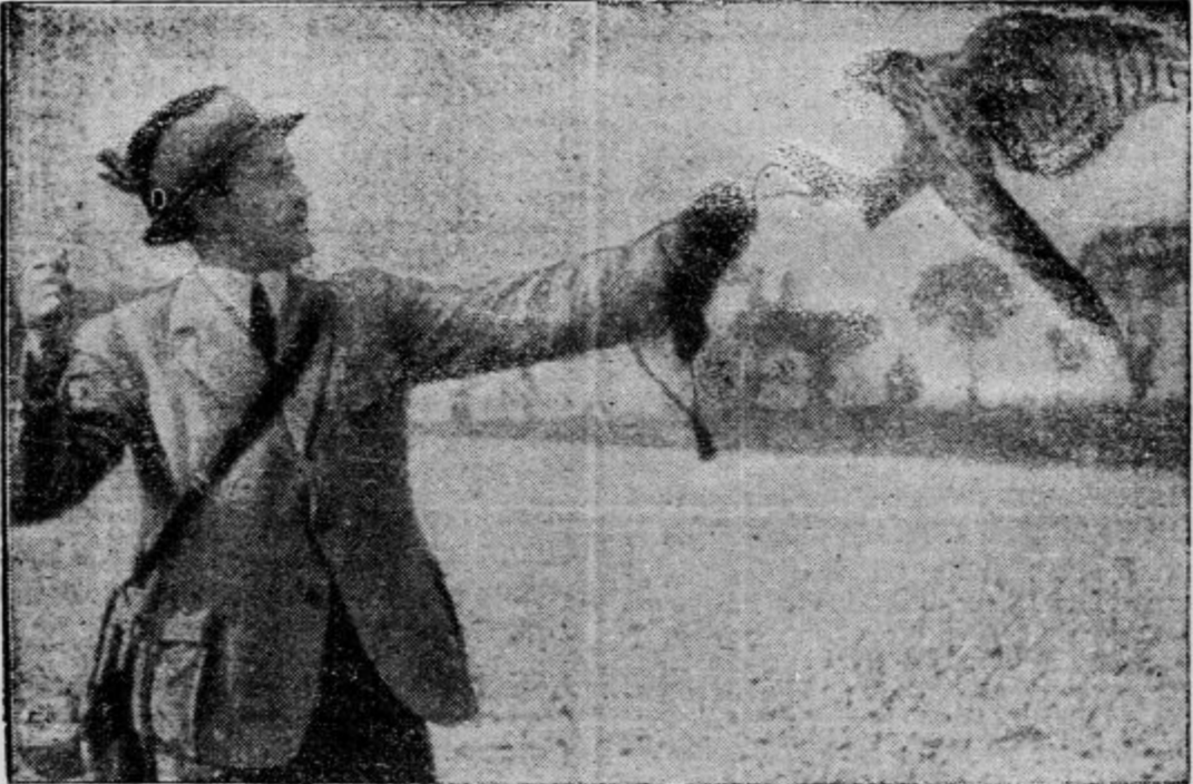
Kragulj je ubogljiv... Prizor iz kulturnega filma: »Živali — pomočnice na lov«

Znano je, da razen tega Ufine odprave po vsem svetu lovijo na filmski trak tuje pokrajine, ljudi in običaje. Vsekakor se Ufa trudi, da si pridobi sloves vsestranskosti, obilnosti in zanimivosti svojega kulturnega programa.