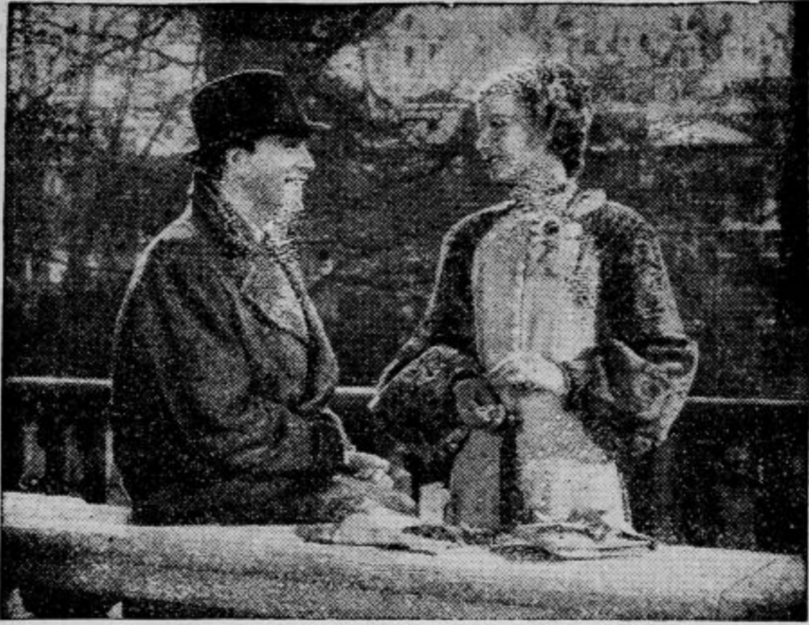
Willy Fritsch in Lilian Harvey sta spet skupaj in sicer v novem Ufinem zvočnem filmu prečudnega imena »Sedem klofut«