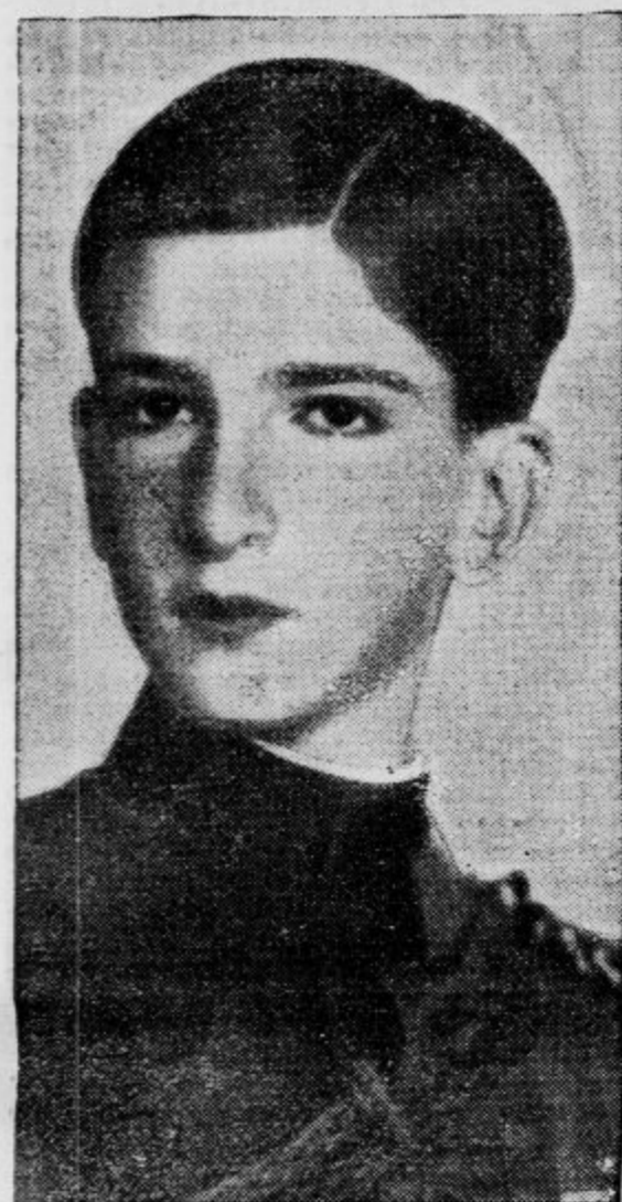
Starešina SKJ Nj. Vel. kralj Peter II

Glavna skupščina SKJ je bila zaključena s navdušenimi vzklíki starešini sokola SKJ Nj. Vel. kralju Petru II., kraljevskemu domu in vsemu sokolstvu.