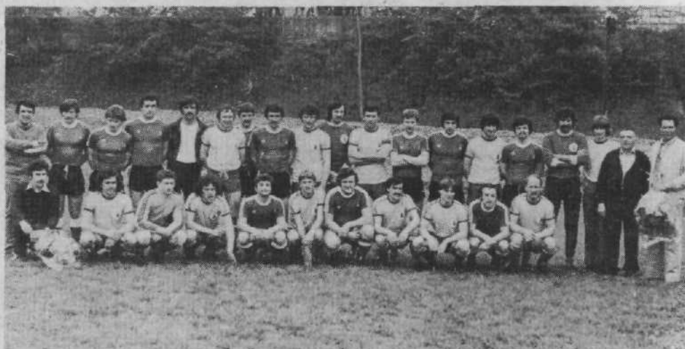
TRŽIČANI NA ČRNUČAH – Marilji odborniki in igralci nogometnega kluba Črnuče so se spet izkazali. Organizirali so povratno srečanje z zamejskim klubom Gaja iz Padrič pri Trstu. Zmagali so domačini 4:3. Srečanje z zamejskimi Slovenci je bilo izredno prisrčno, tekma pa pravi užitek za 200 gledalcev. Na sliki: moštvi pred začetkom srečanja.