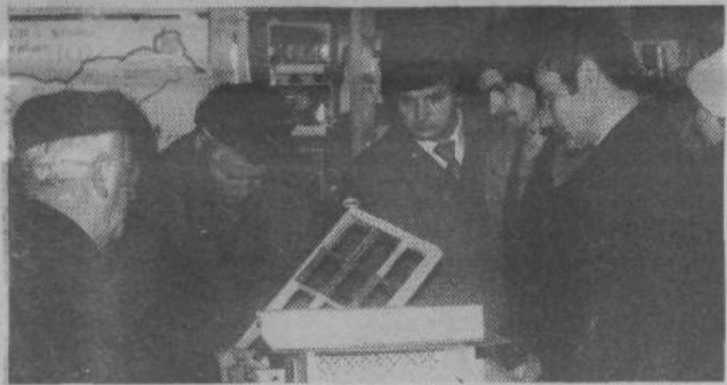
Del proizvodnje v tozdu Izdelki iz plastičnih mas.

Glavni del proizvodnega programa tozda Izdelki iz plastičnih mas v delovni organizaciji Totra so cevi. Proizvajamo cevi iz polietilena za vodovode, plinovode, kanalizacijo in industrijske cevovode, cevi iz polivinilklorida (PVC) za vodovode in drenažo ter cevi iz polipropilena za podno ogrevanje.