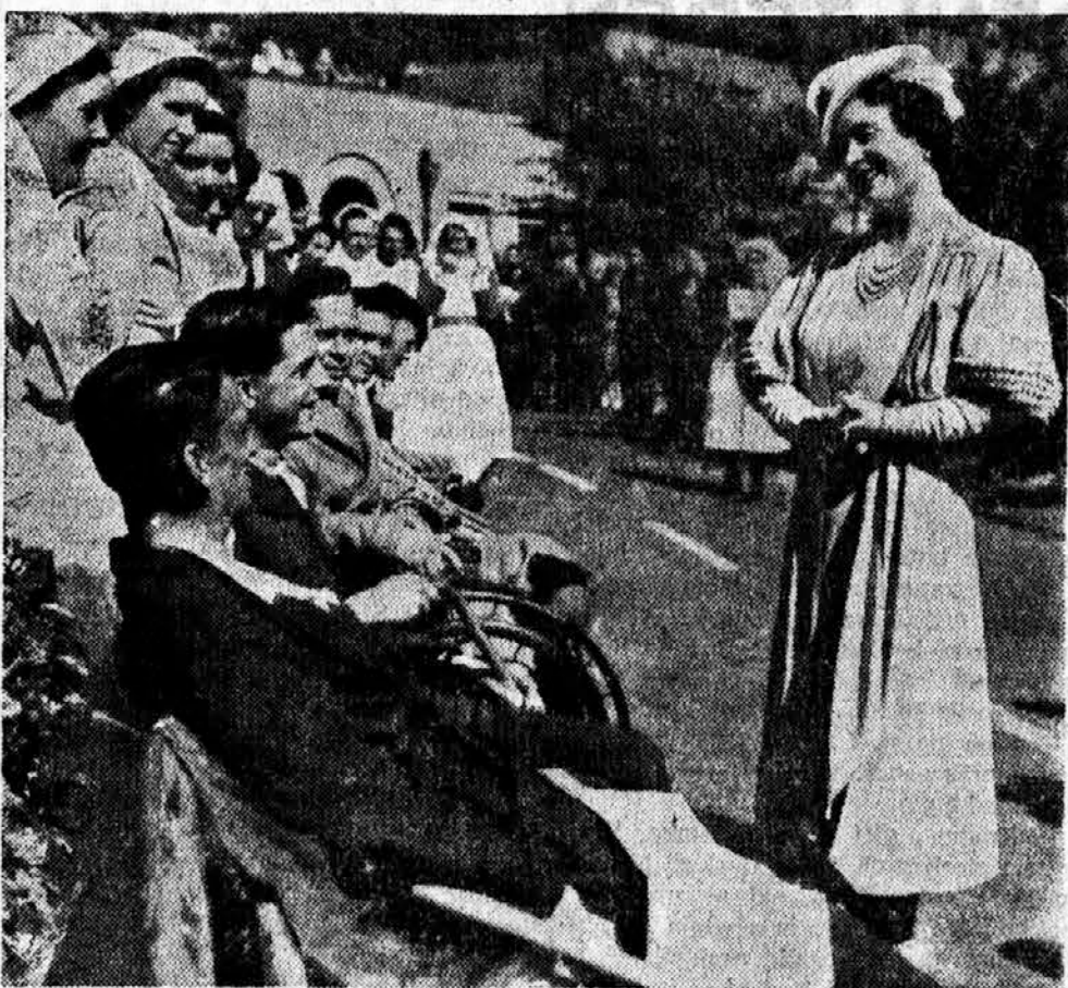
Angleška kraljica Elizabeta je obiskala ranjene vojake