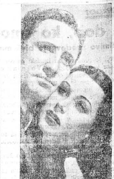
SPENCER TRACY IN HEDY LAMARR v MGM filmu „Valovi strasti“

Med redkimi dobrimi filmi, ki smo jih videli zadnje čase pri nas, je bil nedvomno tudi madžarski film „Umirajoča pomlad“ („Esplanade“) izdelan po istoimenskem delu slovitega modernega madžarskega romanopisca, novelista in dramatika Zilaha Jajosa (madž. naslov „Halalos tavasz“). S tem filmom je dosegla madžarska filmska produkcija svoj doslej največji uspeh, s katerim se lahko kosa z mnogimi najboljšimi deli velikih svetovnih filmskih podjetij. Ta uspeh moramo v gotovi meri pripisati močno erotični