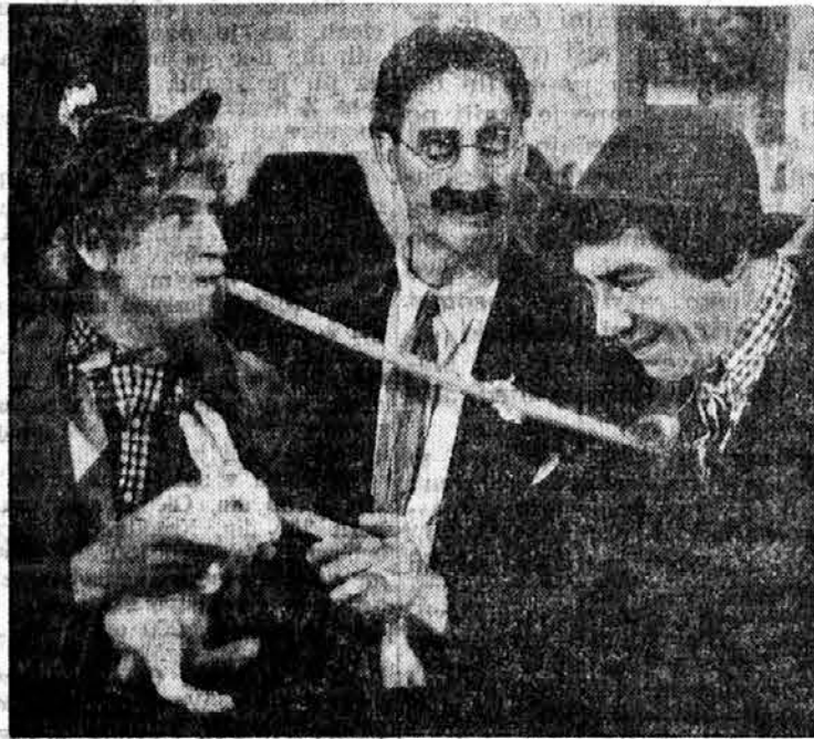
HARPO, GROUCHO IN CHICO MARX (MGM)

Anglije nemoteno normalno naprej. To je pripisali samo značilni angleški hladnokrvnosti. Neko veliko filmsko podjetje je