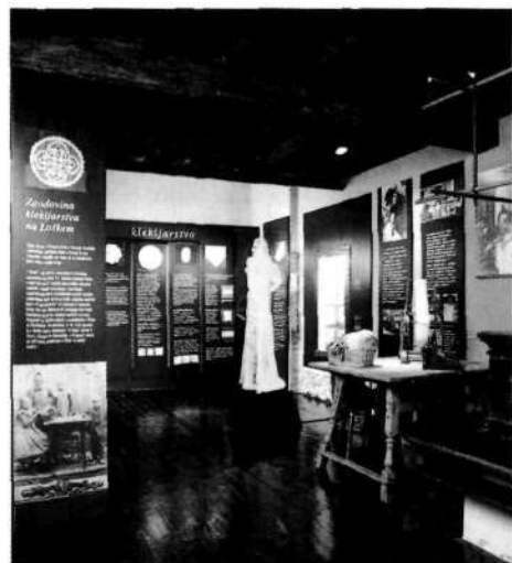
Sodobna zbirka klekljarstva po letu 1998