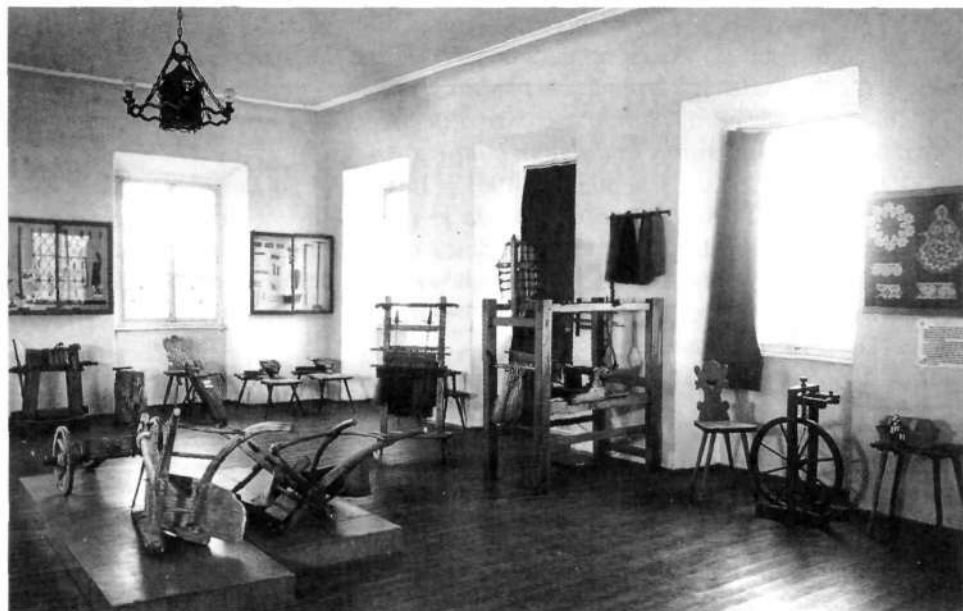
Zbirka poljedelstva, živinoreje in obrti v Loškem muzeju do leta 1974