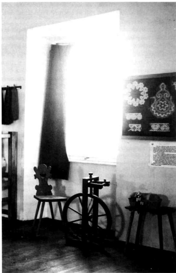
Začetki čipkarske zbirke v sobi obrti leta 1959