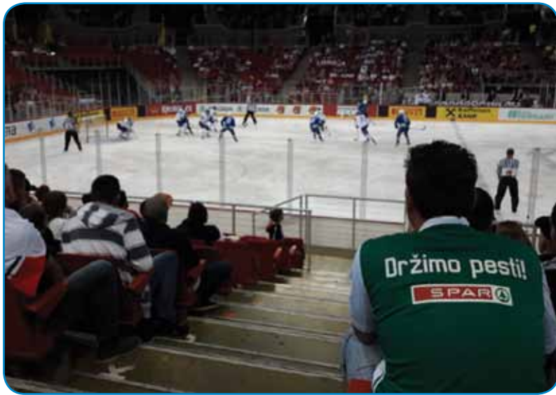
Navijamo - držali smo pesti za naše hokejiste

Če bi vogrska reprezentanca prauti Velki Britaniji gvinila, bi ona drugo leto špilala med 16 najboukšimi reprezentancami sveta. Mi smo tau dramo gledale po televi-