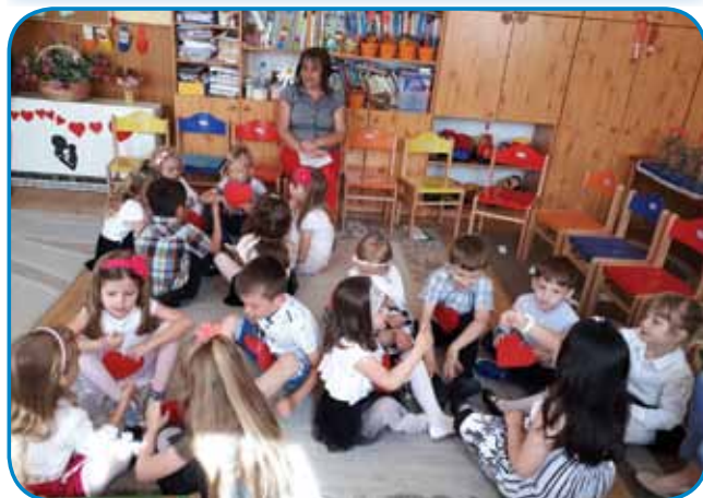
Vrtec Gornji Senik