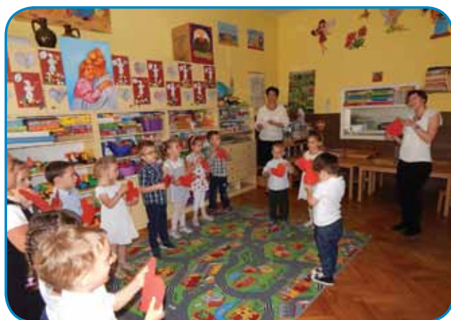
Vrtec Dolnji Senik

Zapisali in fotografirali: vzgojiteljici asistentki Romana Trafela in Andreja Serdt Maučec