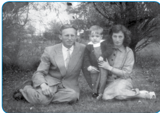
Na starom kejpi z ženov pa sinaum

- Tistoga reda je dobro leko slōjžo, če je stoj v foringo ušo?