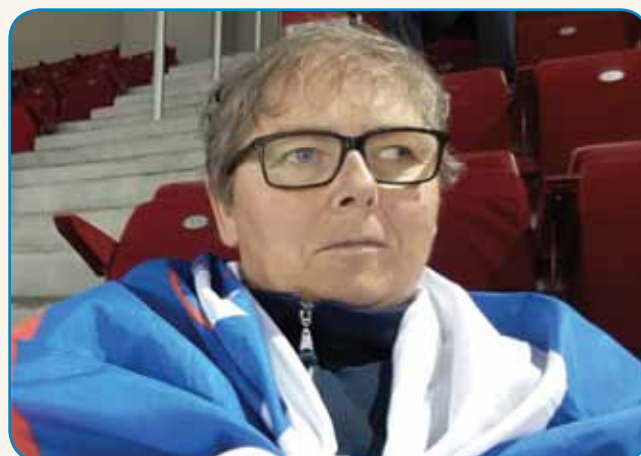
»KDOR NE SKAČE, NI SLOVENČ« stran 10