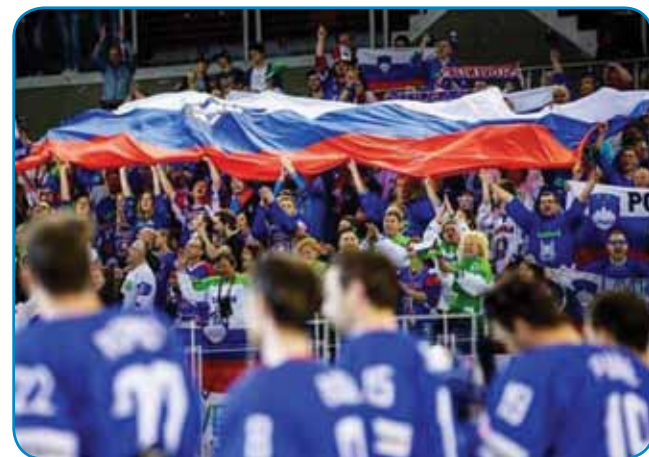
HZS - S tem kejpom so se nam Risi na Facebooki zahvalili za navijaško podporo (Hokejska zveza Slovenije)

na paperi, furt ne vala. »Kdor ne skače, ni Slovenc,« je v zadnji lejtaj najbolje nücani stavek slovenskih navijačov (szurkolók). In rejsan smo skakali. Karte smo na takšom mesti dobile, gé je največ naših navijačov bilou. In tak smo furt, gda je spadno gol, skakali in gorpotegnili velko slovensko zastavo. Petkrat smo tau napravili, vej pa se je tekma končala z rezultatom 5:3.