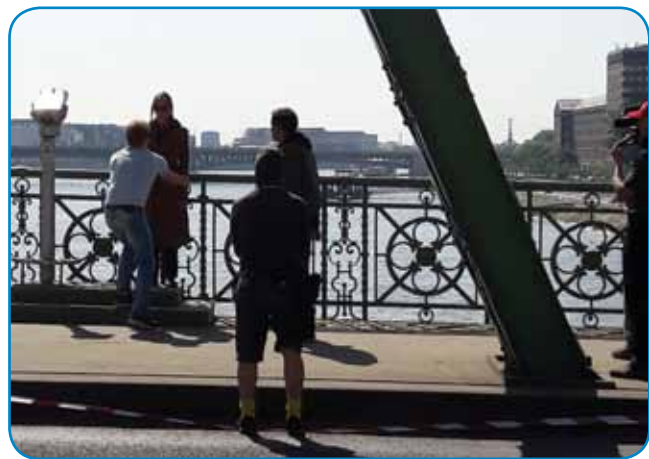
Nadaljevanka - na mosti Szabadság so snemali nadaljevanko

ziji. Samo petnajst sekund je falilo, pa bi vogrskim hokejstom gratalo. Vodili so z