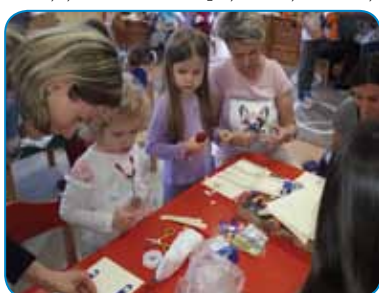
Prijetno ustvarjanje skupaj z otrokom

Delavnica je potekala od poznega popoldneva pa vse do večera in je minila v znamenju prijetnega druženja in pogovora. Prečudovite izdelke so otroci skupaj z mamicami odnesli domov. Le-ti jih bodo vedno spominjali na to, kako lepo je biti in ustvarjati skupaj ter kako pomembno za družinske člane je skupno preživljanje prostega časa.