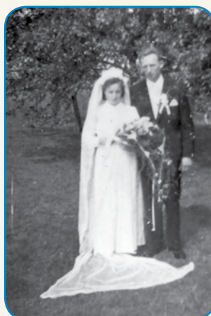
OD RUSOV SEM DAUBO DVA KONJA stran 8