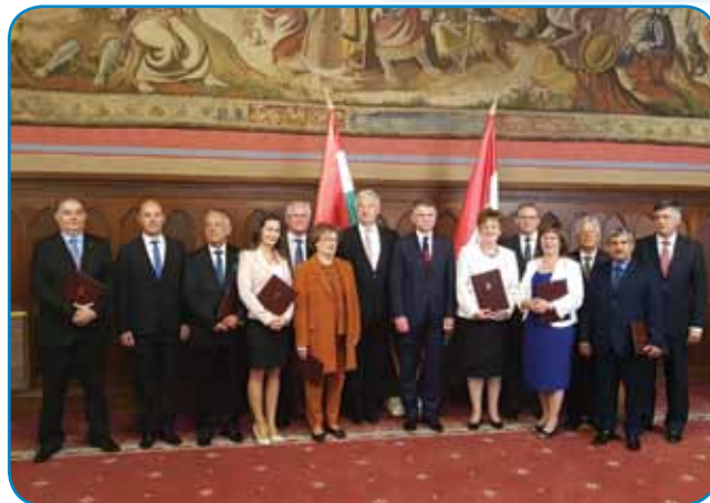
Narodnostni zagovorniki s podpredsednikom vlade Zsoltom Semjénom in predsednikom parlamenta Lászlóm Kövérjem (na sredini)