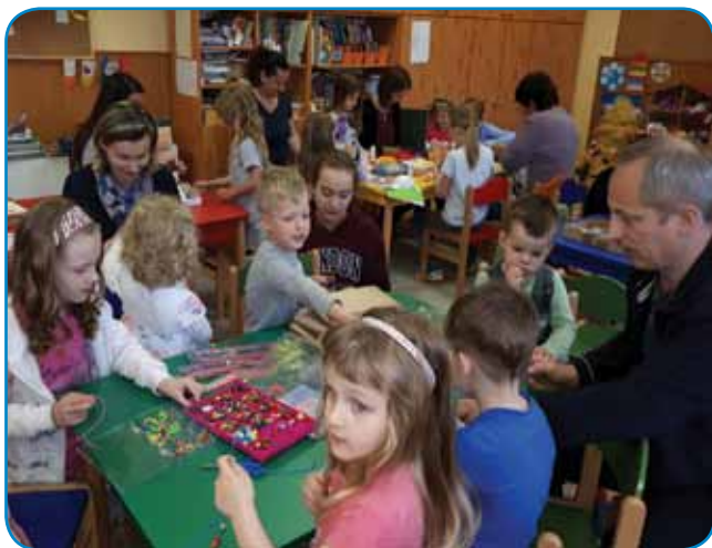
Naredimo si prelepo zapestnico

lončku, zapestnice z barvnimi kroglicami, raznih poslikav kamnov različnih oblik, barvnih