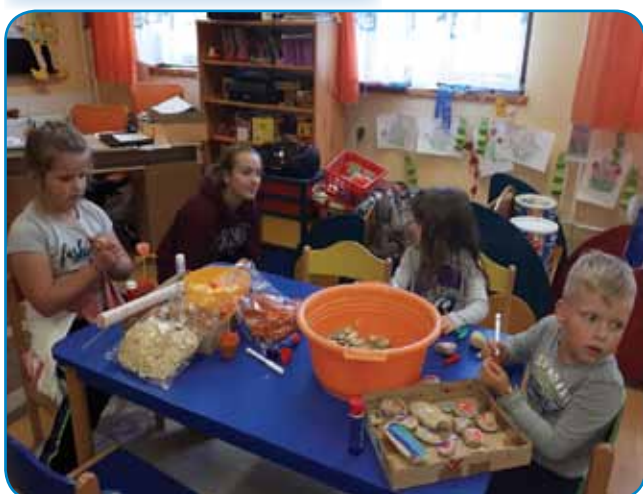
Risanje in slikanje na kamne ter okrasna rožica v okrasnem cvetličnem lončku

mi mamicami izdelali najrazličnejše izdelke - od svetleče rožice iz srčkov v manjšem cvetličnem