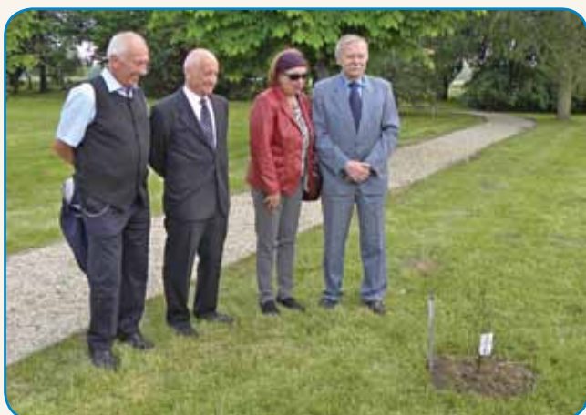
PO VELIKI BELI CESTI - TUDI ZDAJ stran 3