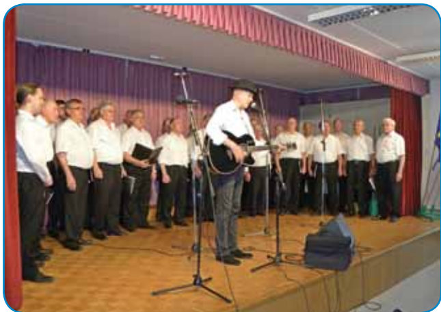
Moški zbor Slava Klavora iz Maribora in pevec Vlado Kreslin so navdušili obiskovalce, saj so ustvarili čudovit kulturni dogodek, ki bi prišel še bolj do izraza, če vreme ne bi ponagajalo in bi petje in glasbo poslušali v Vrto spominov in tovarištva na Petanjcih

S 17. Dnevom spominov in tovarištva na Petanjcih so se bolj kot vreme »poigrali« vremenoslovci, ki so za petkovo popoldne (4. maj) napovedali neurje tudi nad Prekmurjem, zato je Ustanova dr. Šiftarjeva fundacija tradicionalni majski dogodek prestavila in odlično izpeljala v dvorani občine Tišina. Vreme se je res poslabšalo, ampak ravno takrat, ko so se udeleženci po končani prireditvi zbrali ob sproščnem druženju na občinskem dvorišču, hudo neurje pa se je razbesnelo nekaj deset kilometrov v stran, na Ptuj in okolici. Večer prej je podobno neurje pustošilo po delu Prekmurja in v sosednji Avstriji.