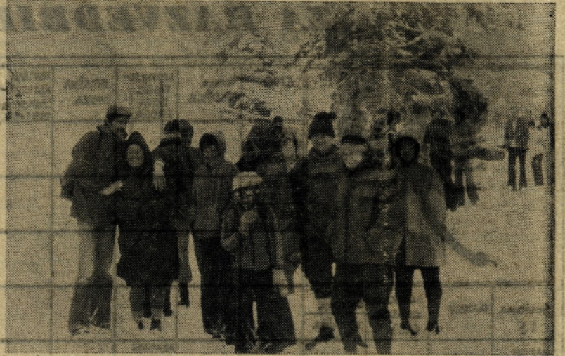
Člani naše planinske skupine na planinskem izletu