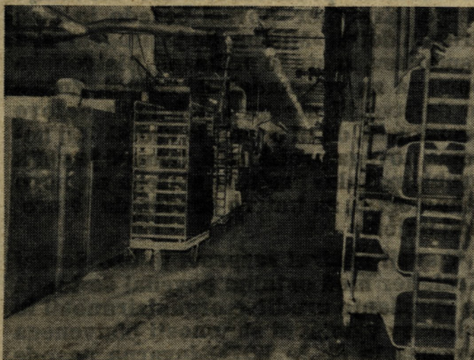
V naši TOZD posoda je značilna utesenjenost. Morda bi se le dalo mehanizirati osrednji transport?!

Pri takem prizadevanju pa moramo nehati z »dokazovanjem« raznih »težav, tarnanjem, polemiziranjem o tem in onem, ki nam nič ne koristi, zahrbtnim namigovanjem na slabosti naših sodelavcev, pohajkovanjem med delovnim časom, razsipavanjem z dragocenim materialom in podobnimi škodljivimi pojavi, ki pogojujejo naše neuspehe in kalijo dobre odnose med nami.