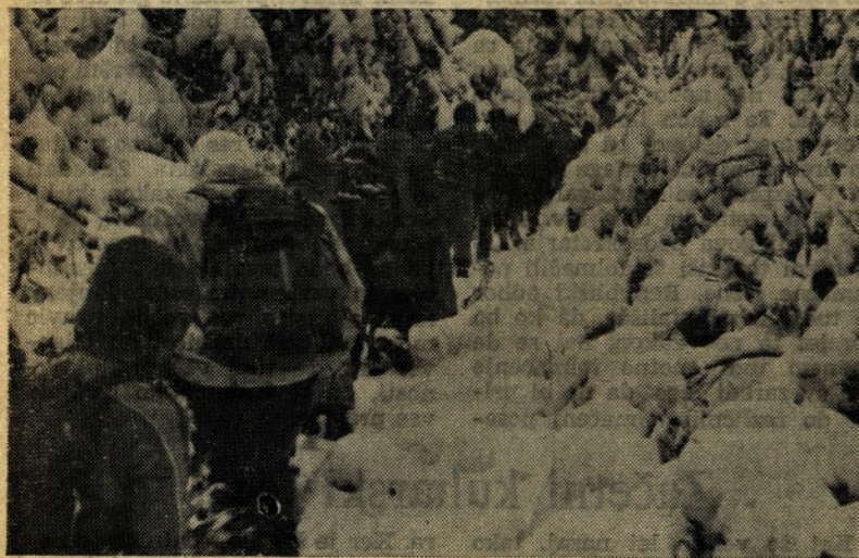
Naši planinci na pohodu v čarobni svet narave

nji ledenik globoko izdolbel med južnim pobočjem Dleskovca in vzhodno platjo Deske. Planina je zapuščena, le v bližini enega pastirskega stana je razpadajoče zajetje vode. Na Vodolah se je pisana družina zaustavila, kjer smo se malo odpočili. Med tem je začelo rahlo deževati in iz nahrbtnikov smo vzeli vsak svoj pripomoček proti dežju, kot pale-rine, dežne plašče, dežnike, kape in rokavice kot zaščito proti hladnemu vetru. Šele tukaj visokogorski gozd z izredno bogato floro prihaja v pritlikavo rast ruševja. Nad krnico smo nadaljevali po strmih pobočjih, tako da smo dosegli del z imenom Inkret. Od tu smo sledili kovinskim smernim drogovom, ki so v zimskem času namenjeni smučarjem in redkim planincem. Kmalu nad Inkretom smo šli skozi vrtačo in po sever-