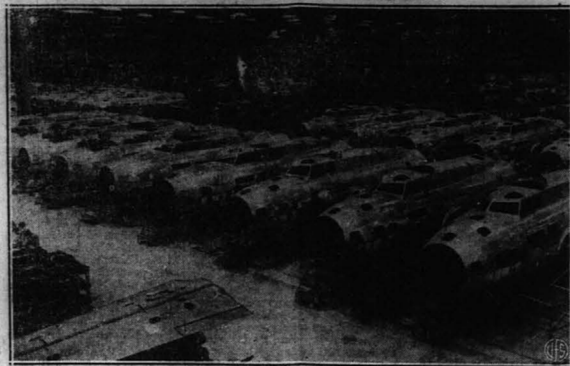
Aeroplanska tovarna v Seattle Wash., je s polno paro na delu da producira čim največ vojnih aeroplanov, in gornja slika kaže vrste letal ki so v delu v tej tovarni.