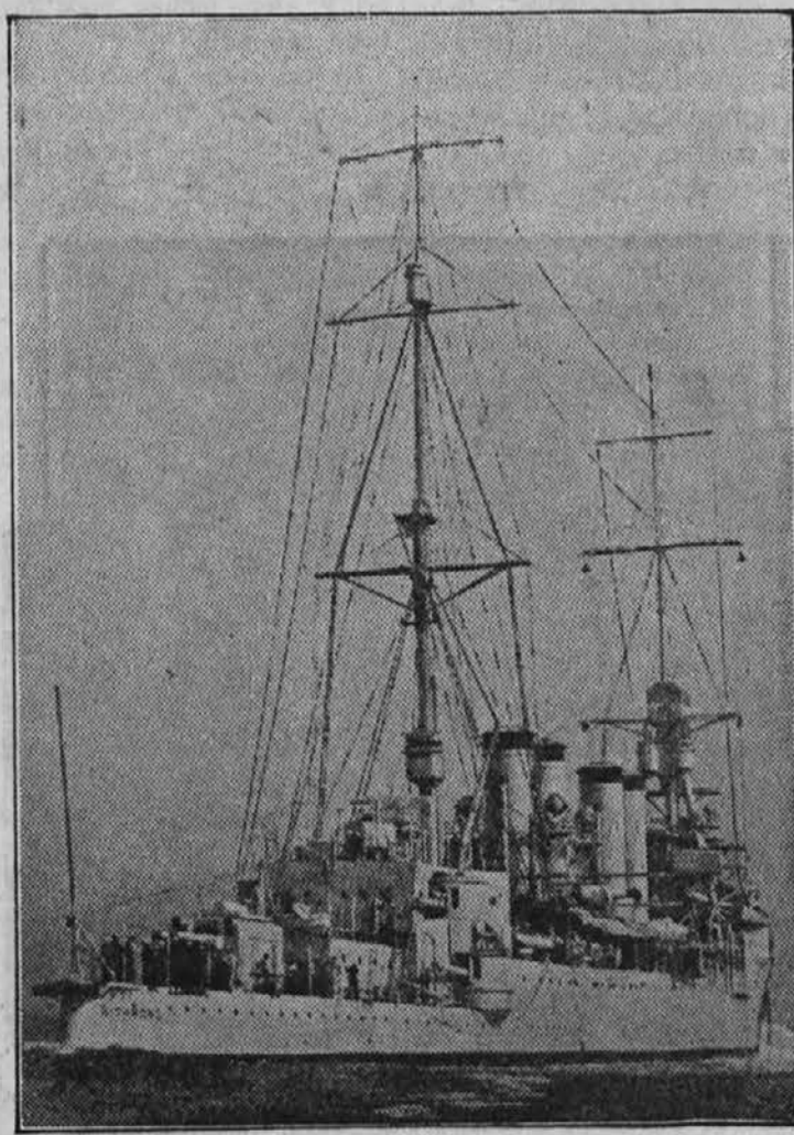
Križarka "Richmond", ena izmed severnoameriških vojnih edinic, ki čuvajo ameriško interese na Kubi, kjer se še ne ve, kaj se bo izcimilo iz sedanje zmede