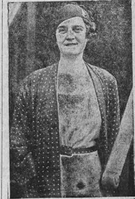
Bivša ruska velika kneginja Marija potuje po Evropi kot poročevalka raznih ameriških listov.

Knjiga stane $ 1.50 ter se prodaja v uredništvu "Naroda", pri "Banco Germnico" in "Banco Holandés".