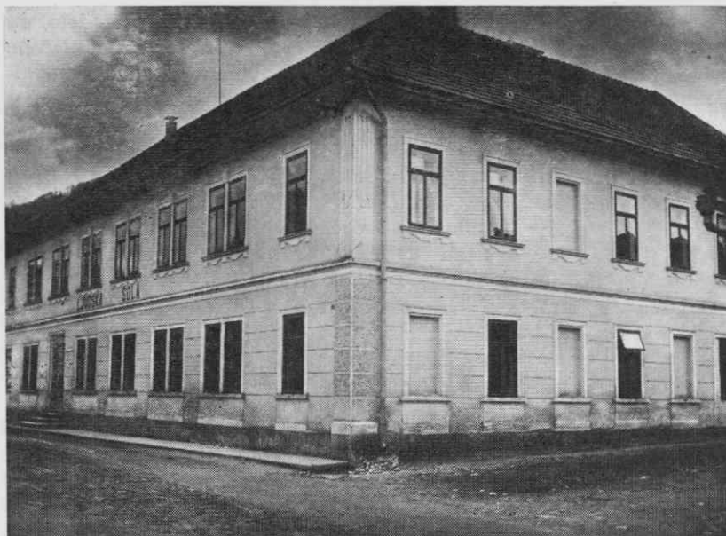
1. Šolsko poslopje v Sodražici