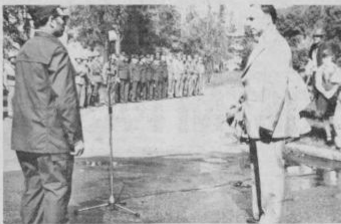
Iz lanskoletne vaje CZ in TO v Kidričevem: Raport predsednika sveta KS.