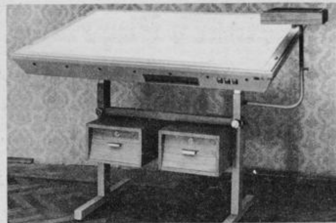
Osvetljevalna miza TEHNOGRAFIK — COORDINAT