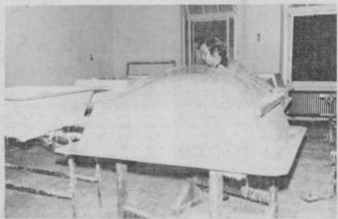
V studeniškem kolektivu, pri proizvodnji podstavkov in nosilcev