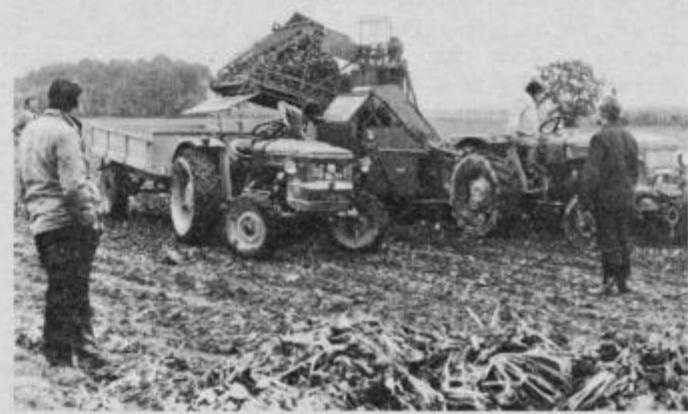
Izkop sladkorne pese s kombajnom NEPTUN