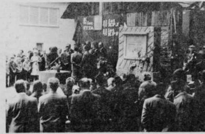
Spominsko obeležje pri Suparjevih, kjer je delovala Tehnika Lacko.