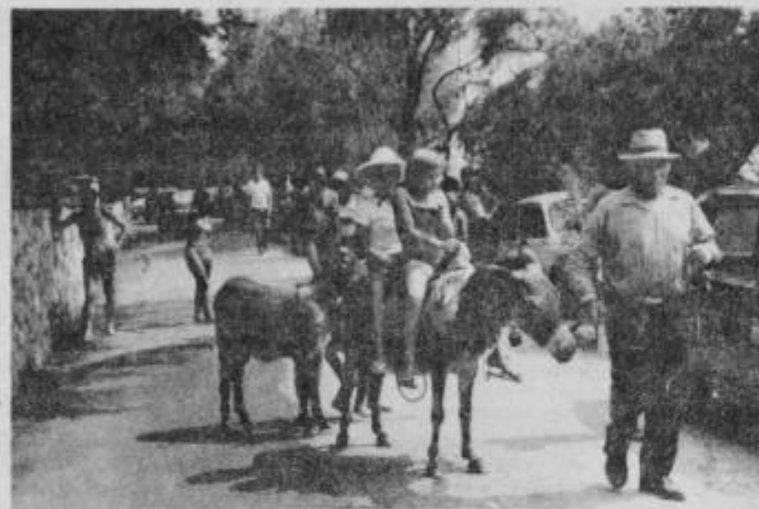
Tudi prihodnje leto bo najmlajšim lepo v Crikvenici.

kuhinsko nišo tako, da bi si člani kolektiva, ki to želijo lahko sami kuhali ali pa bi se hranili v restavracijah. Tudi za to investicijo bo potrebno združiti sredstva v višini 5.000.000 din.