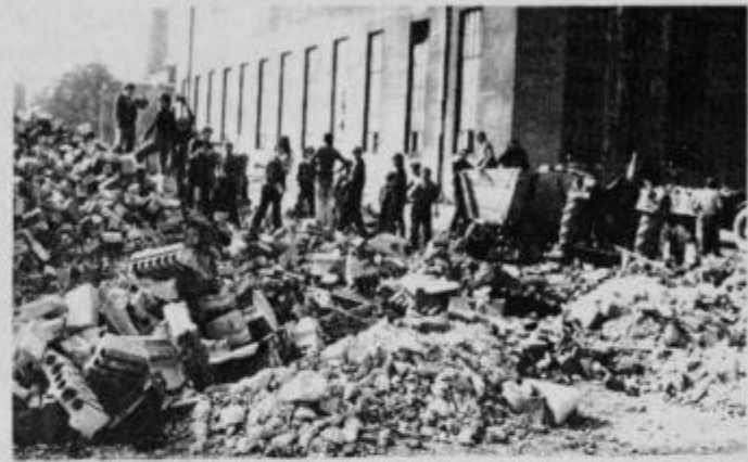
Učenci osnovne šole, skupaj s krajanji Destnika pri nalaganju šamotne opeke v TGA Kidričevu

je prispevala KS Destnik s samoprispevkom občanov 50 %, namenski delež je prispevala tudi izobraževalna skupnost Ptuj, vse ostalo pa bodo prispevali krajanji v obliki prostovoljnega dela. Upa-