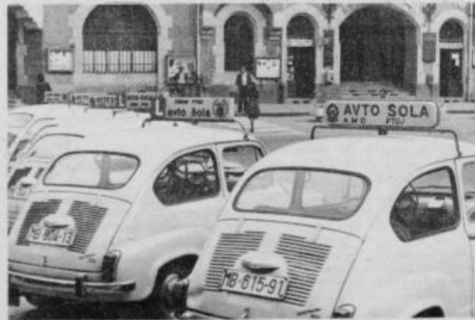
Za avtošolo v bodoče na ožjem mestnem območju ne bo več toliko prostosti kot sedaj.