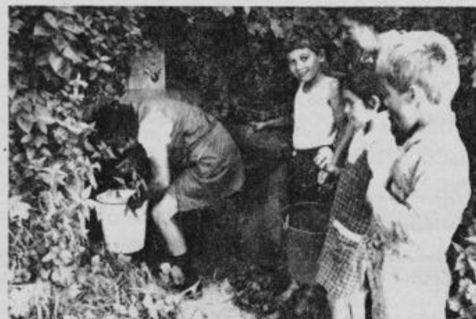
Tudi po večkrat na dan se je potrebno povzpeti po pobočjih Boča z vedri do Zofijinega vodnjaka

Za nadomestilo njihovega pomanjkanja bi izvajalec del Komunalno podjetje Rog. Slatina, zagotovil