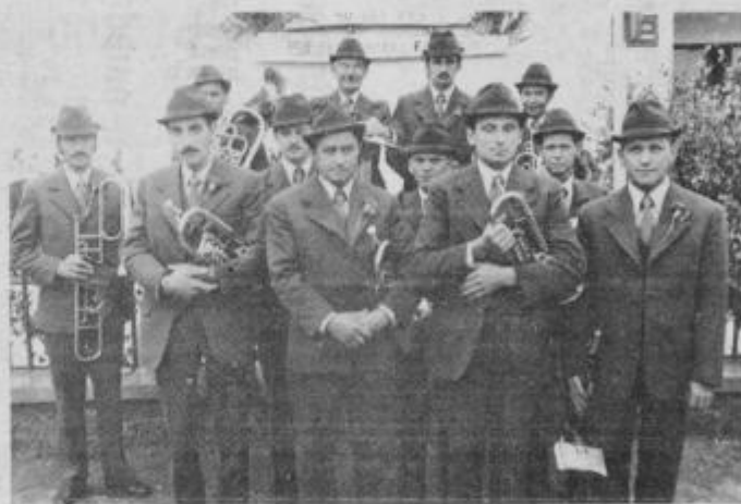
„Frajhajmska“ godba na pihala ob svečanosti jubileja.