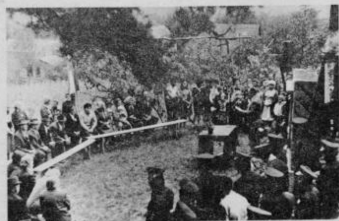
Osrednja proslava prvega krajevnega praznika je bila v Stogovcah, slavnostni govornik pa je bil Zvonko Sagadin.