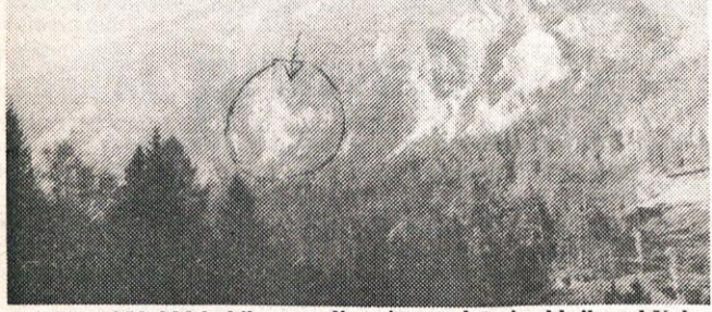
Približno 250.000 kubikov zemlje oziroma skoraj cel hrib pod Kalenom (v smeri Krvavca) je zgrmelo v dolino Bistričice

ve hiše, Raščev trg, Županje njeve, sotočje reke Kamniške Bistričice in Bistričice, del Godiča, pod jezom pri Prodniku, najhujše pa je bilo ob gasilskem domu in celotni strugi do KIK. Hudournik Bistričica je vedno bolj grozil zaradi erozije na več kritičnih točkah. Tudi na drugih krajih je bila škoda velika.