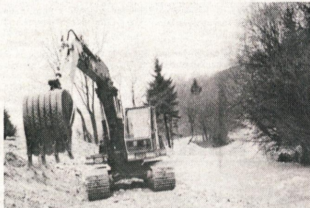
Z bagrom čistijo strugo reke Kamniške Bistrice.

Podatki potrjujejo, da so občani, organizacije, društva, KS, podjetja, obrtniki in drugi nesebično priskočili na pomoč prizadetemu prebivalstvu. Pomoč še prihaja, darovalce pa bomo objavili v naslednjih številkah.