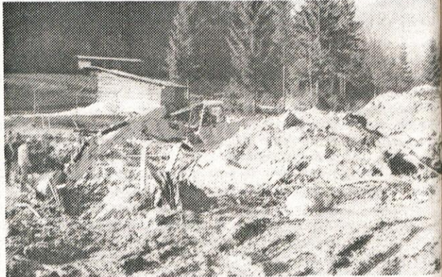
Reševanje mostu v zaselku Klemenčevo in čiščenje ceste Bistričice — Klemenčevo

mogel imeti take rušilne moči. Da bi to preprečili vsaj za prihodnje, menijo v KS, bi morala OVS (območna vodna skupnost) in PUH (podjetje za urejanje hudournikov) zaradi erozije in stalnega poglabljanja rečne struge varovati obe dolini s kamnitimi bregovi in obrambnimi zidovi.