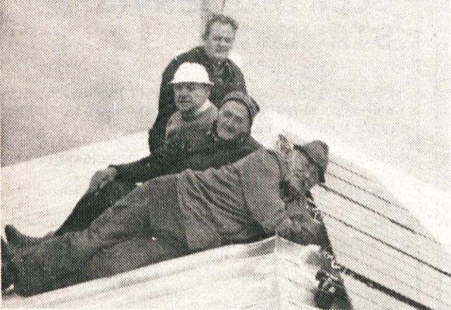
Montaža kolektorjev – skupina kamniških planincev

Zaradi dobrih rezultatov, ki so bili doseženi na Kamniškem sedlu so se v Planinskem društvu Kamnik že odločili, da bodo tudi na Kokrškem sedlu namestili take naprave in so jih že tudi kupili. Montirali jih bodo pred začetkom naslednje planinske sezone. V tem