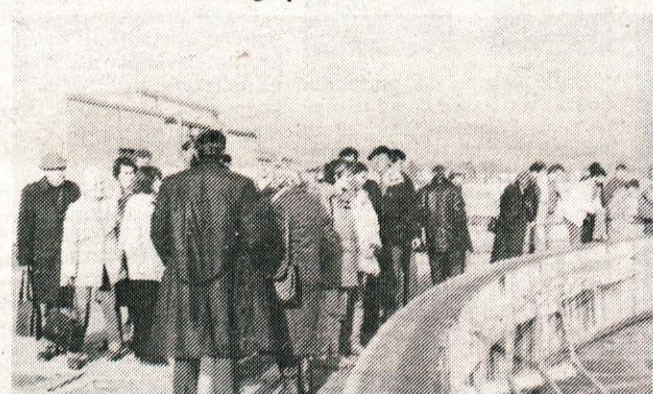
Centralna čistilna naprava odpadnih vod v Celovcu. Skupina Zelenih Kamnika ob zadnjem čistilnem bazenu, odkoder odteka v Dravo 95 odstotno prečiščena odpadna voda.