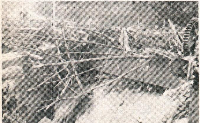
Velik jez v času poplav.

Vsa ta dela niso bila zaman, saj je voda zalila v celoti obrat ob 22. uri. Posledice tega neurja so bile