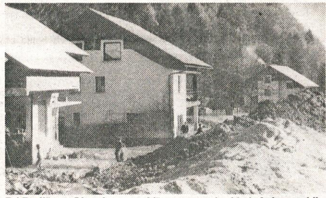
Pri Pavliču na Okroglem — na hišnem ometu je videti, do kam so bile hiše zasute z blatno gnoto

plaz (verjetno se je nad tem področjem utrgal oblak), ki se je, pomešan z vodo, premikal navzdol in pred seboj rušil vse pregraje. Valil je ogromne skale — do 4 m 3 velike. Vsi mostovi in brvi so bili porušeni, med njimi most proti Slatensku, zasut je bil most proti Slevem. Vasi Okroglo, Klemenčevo, Zakal in Sleva so bile odrezane. Na Zakal je bilo možno priti le iz kranjske smeri, iz smeri Šenturške gore. Po izjavi Slavka Kuharja je prvič počilo v zgodnjih jutranjih urah, 3. novembra, ko se je sprožil plaz. Valovi blata in kamenja so prihajali v polurnih presledkih. To je trajalo vse do dopoldanskih ur, ko se je stanje le nekoliko umirilo.