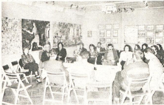
V Galeriji »Veronika« so Kamničani modrovali o kulturi.

V razpravi je bilo opozorjeno še na večletne namere ZKO-ja po razširitvi na prireditveno posredovalnico, kar bi pomenilo zaposlitev še enega delavca. Osnovna dejavnost se je namreč tako razširila, da en človek komaj še zmore vse. Govor je stekel tudi o problemu mladinske kul-