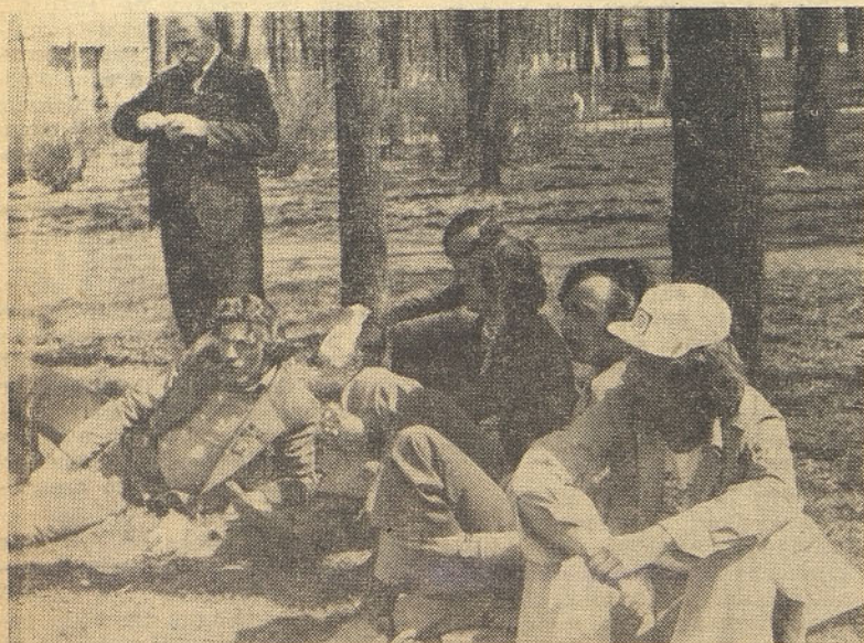
Po odhodu štafete mladosti iz Brčkega se je počitek zelo prilegel