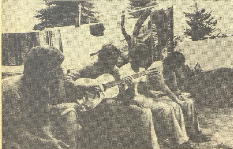
V brigadirskem naselju

d) Republiška akcija KOŽBANA 76 (Goriška brda), na akciji sodelujemo v brigadi RDEČI REVIRJI, ki jo sestavljajo brigadirji iz treh revirskih občin, sodelujemo pa v IV. izmeni od 8. do 29. 8.