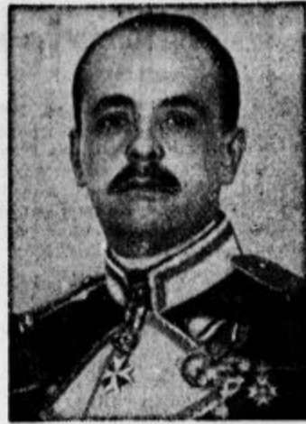
GROF STEFAN CSAKY novi ogrski zunanji minister

Ravnateljstvo poljskih državnih železnic je pred nekaj dnevi objavilo podatke o svojem poslovanju. Iz teh je zlasti razvidno, da se po poljskih železnicah prevaža izredno veliko zastojkarjev. Leta 1937 so nadzorni organi na vsej poljski železniški mreži prijeli 178.000 ljudi, ki so se vozili brez vozovnic. Največ takih zastojkarjev je v okrožju Wilne (92.000), v okrožju Varšave pa jih je samo 37.000. Seveda pa te številke še daleč niso popolne, ker si nihče ne domišlja, da so nadzorni organi zasledili prav vsakega zastojkarja.