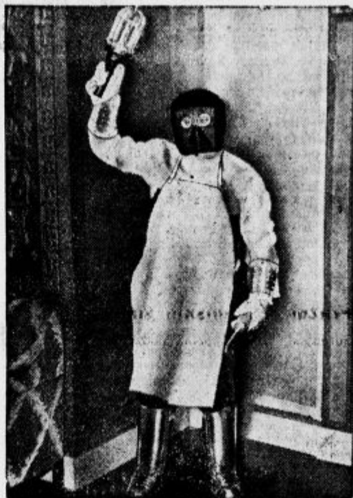
V OBRAMBO PROTI PLINOM

Tako ta Amerikanec. Ni mogoče tajiti, da je to precej drugače kakor pritisniti na kljuko in zavpiti s praga »Ali potrebujete kakšnega...?«