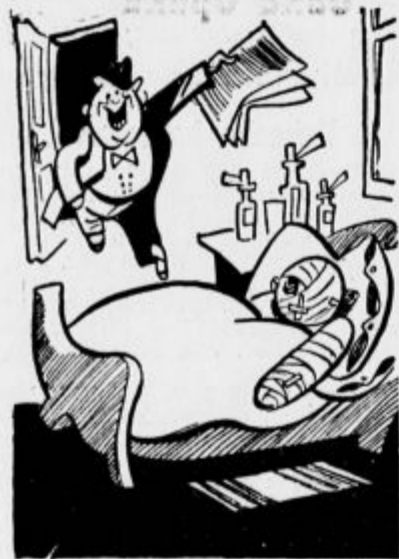
Ta je pa zadel!

V Londonu so preizkusili fuljenje širen. Kl naj bi v primeru sovražnega bombnega napada prebivalce opozorili na nevarnost. Casopisje pa poroča, da so se dosedanje alarmne naprave izkazale za nezadostne, ker jih v nekaterih delih mesta sploh niso slišali