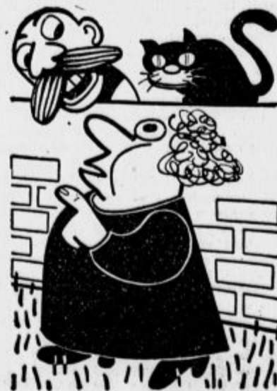
Škoda je treba popraviti

na Škotskem, nižje v Evropi ga seveda še ni. Kakor je videti, te mlade dijakinje čez poletje niso nič pozabile