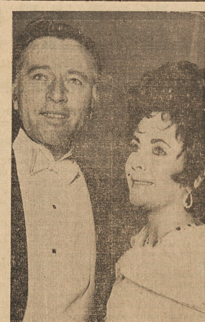
ZA 30 LET V NAJEM — Richard in Elizabeth Burton bi rada kupila dom v bližini Puerto Vallarta v Mehiki, pa ji ma to ni mogoče, ker nista mehiška državljana. Po posredovanju predsednika republike Luisa Echeverrie so jima dovolili vzeti zaželjeno posest v 30-letni "najem".