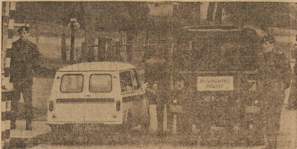
PREVIDNOST NA MESTU! — Britanske čete pregledujejo dokumente vseh, ki prihajajo v bližino stanovanja princeze Ane in nje nega-voja Marka Phillipsa v Oak Grove.