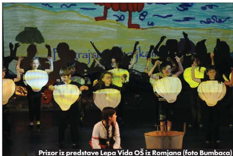
Prizor iz predstave Lepa Vida OŠ iz Romjana

bučnem ploskanju šolskih vrstnikov jim je najbolj laskave pohvalne besede namenil častni gost prireditve, pesnik Tone Pavček,