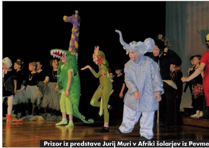
Prizor iz predstave Jurij Muri v Afriki šolarjev iz Pevme