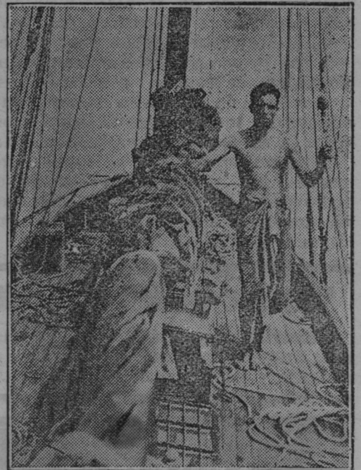
Z jadrnico hoče objadrati svet Francoz Alain Gerbault, ki se je podal na pot dne 27. septembra 1932 iz francoske luke v Marseille.