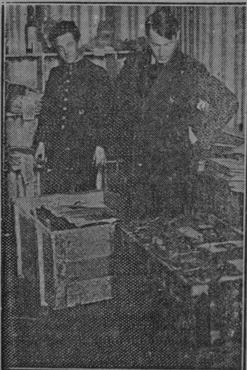
Prtljaga francoskega sleparja Staviskega.