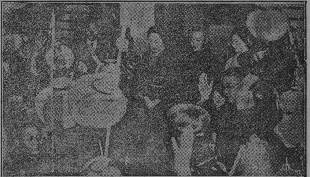
Na Japonskem so dobili prestolonaslednika in celo cesarstvo se je vzradostilo radi tega dogodka. Cesarski dvor se zahvaljuje ljudskemu navdušenju.

Mladostni vlomilci in tatevi na za- tožni klopi. Lansko poletje in jesen je vršila mladostna vlomilska družba pravo strahovlado nad mestom Kranj in nad okolico. Organizirana brezposelna družba se je klatila okrog pod svojim glavarjem in vlamljala, kjerkoli je čula, da je kaj denarja. Obtožnica pravi, da so nepridipravi lani dne 7. sept. pri belem dnevu udrli v trgovino Ahačič ter Šiferer v Kranju. Odnegli so gotovine 8900 Din. Glavar je razdelil plen med svoje tovariše tako, da je prejel eden 2200 Din, drugi 1200 Din. Po posrečenem vlamu se je odpeljala deteljica na Jesenice ter Bled ter zapravljala denar. Pri drugem večjem vlamu v Šavrovo krčmo v Kranju so računali na