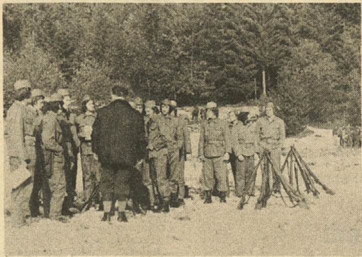
Vaje za obrambo usposabljanja mladih

Poudariti je treba, da v JLA še vedno ni dovolj slovenskih starešin. Razmere se prepočasno zboljšujejo, ker še nismo dosegli