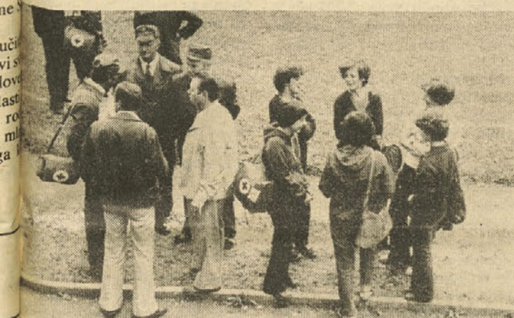
Ekipa prve pomoči Centra srednjih šol na Jesenicah

Poudariti je treba, da v JLA še vedno ni dovolj slovenskih starešin. Razmere se prepočasno zboljšujejo, ker še nismo dosegli