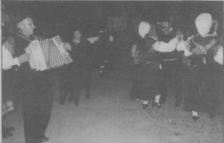
Na novembrskem srečanju v Guastalli je nastopila tudi folklorna skupina, ki deluje v sestavu aktiva kmečkih žena pri TZO Dobrunje

Ukinjanja tozdogov se je dotaknilo nekaj razpravljalcev, ugotovili so, da ukinjanje tozdogov ni povsod že tudi zmanjševanje samoupravljanja, tozdogi se bodo ukinjali, pa tudi nastajali novi,