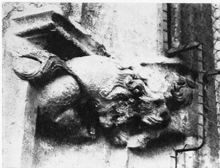
Sl. 145. Zagreb, katedrala, lav

glava je prikazana u trenutku kad progovara. Ona po svoj prilici prikazuje svojim individualnim, markantnim crtama lica samog majstora. 32 Nije li upravo ta glava iskusnog i neosporno u smislu likovnog razvoja naprednog majstora domet, koji se mogao postići unutar razvoja Parlerove škole s istovremenom pojavom Clausa Slutera, koji na Zapadu dolazi na prijelazu iz XIV. u XV. stoljeće do srodnih realizacija?