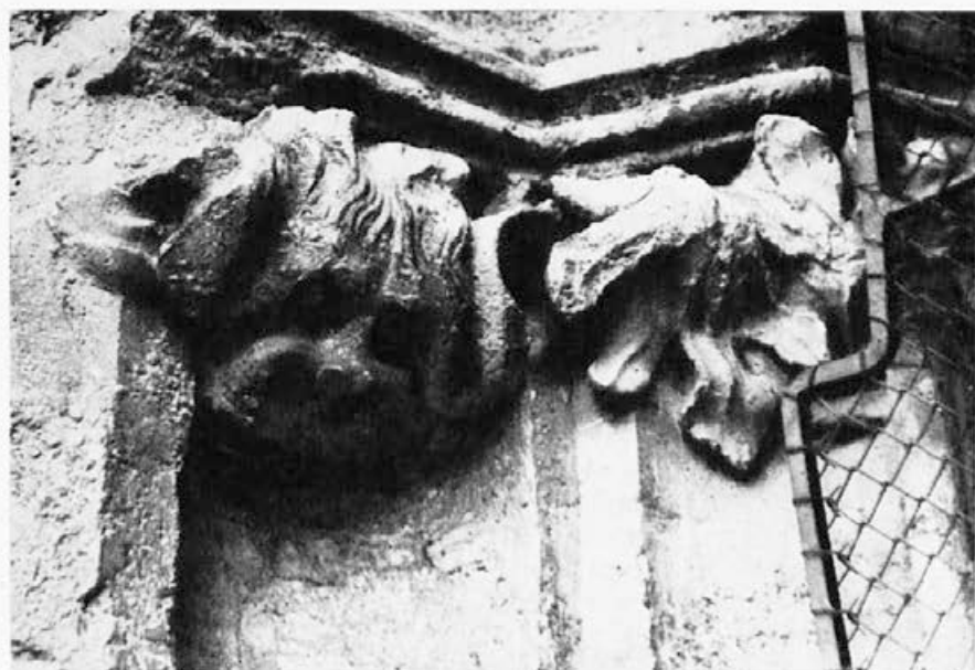
Sl. 141. Zagreb, katedrala, maska, list

pretvara u živost govora otvorenih ustiju (sl. 135), krilati zmajevi iscerenih zubi s šišmišovim krilima (sl. 142, 147), 20 i — da ne nabrajam dalje — hvatanje pandžama za profilirani obod (sl. 136, 138, 142, 147). 21 Sve ovo govori za bliski dodir s Parlerovom radionicom u Pragu.