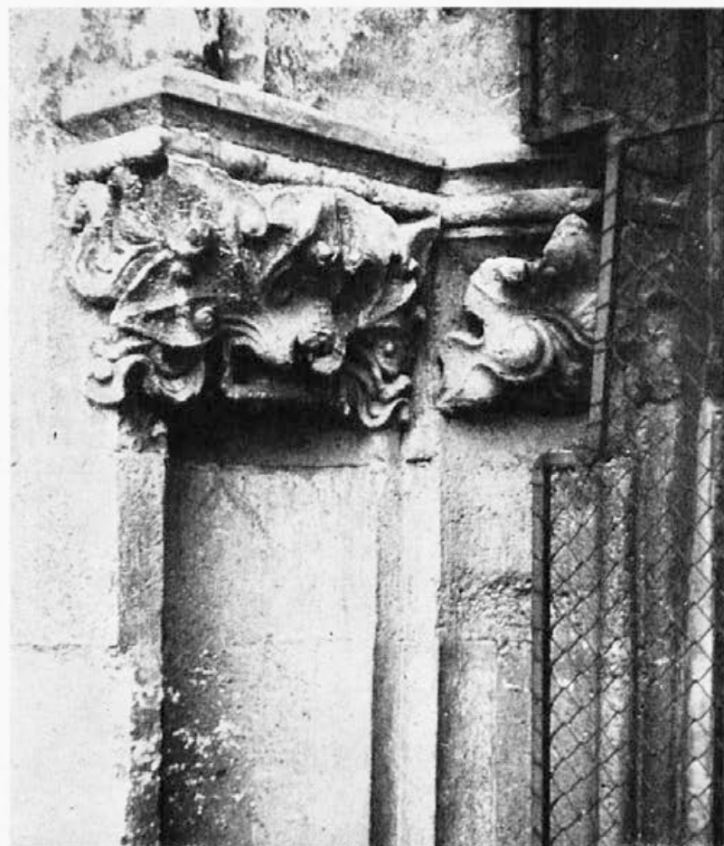
Sl. 143. Zagreb, katedrala, glava monstruma, list

Ceve, stilski su i po ikonografskome izboru bliže praškim, nego zagrebačkim plastikama: radi se o maskama kod kojih se više polaže važnost na sugestivno djelovanje, nego na estetski dojam. Zbog pretežne sklonosti karikiranju, kod njih ne dolazi do izražaja u tolikoj mjeri onaj smjer, koji stvarna bića želi prikazati što prirodnije, za čim je išao majstor »Pasje glave«, »Muške glave«, »Pasa«, »Lava« i »Lavičine glave« u Zagrebu. A takova pretežna sklonost karikiranju očita je i na konzolama s fantastičnim nakazama, koje su u vezi s praškim djelima nastale u Beču (katedrala sv. Stjepana i Maria am Gestade). 27a