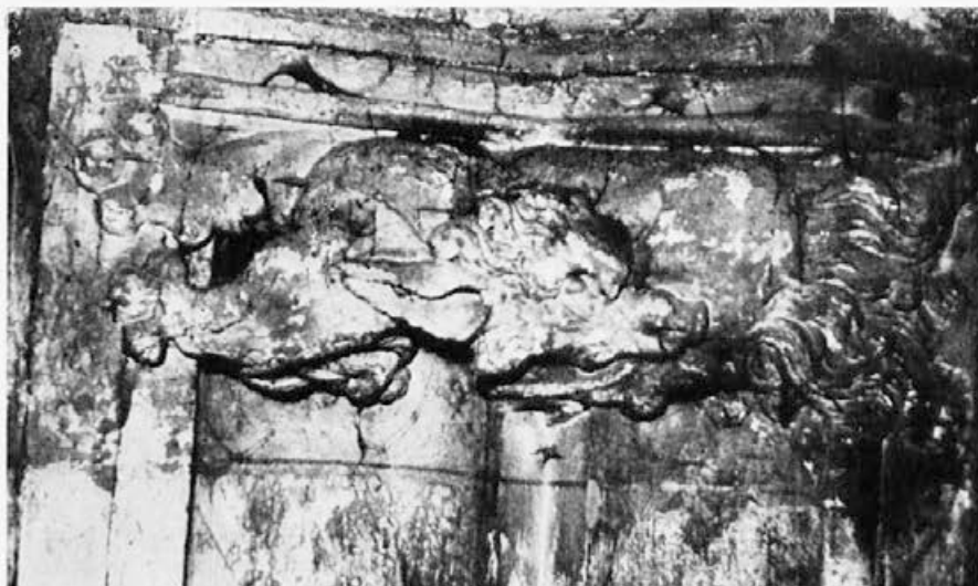
Sl. 158. Zagreb, katedrala, pas

Kad izvori o njima šute, potrebno je saslušati govor ikonografije i stila. Opće je poznata stvar u stručnoj literaturi, da je najmnogobrojnija galerija s likovima fantastičnih monstruma, realnih životinja i portreta suvremenih ljudi ostvarena unutar praške »Bauhütte« Petra Parlera na praškoj katedrali i na tornju mosta Karla IV. 3 Da li u glasovitim