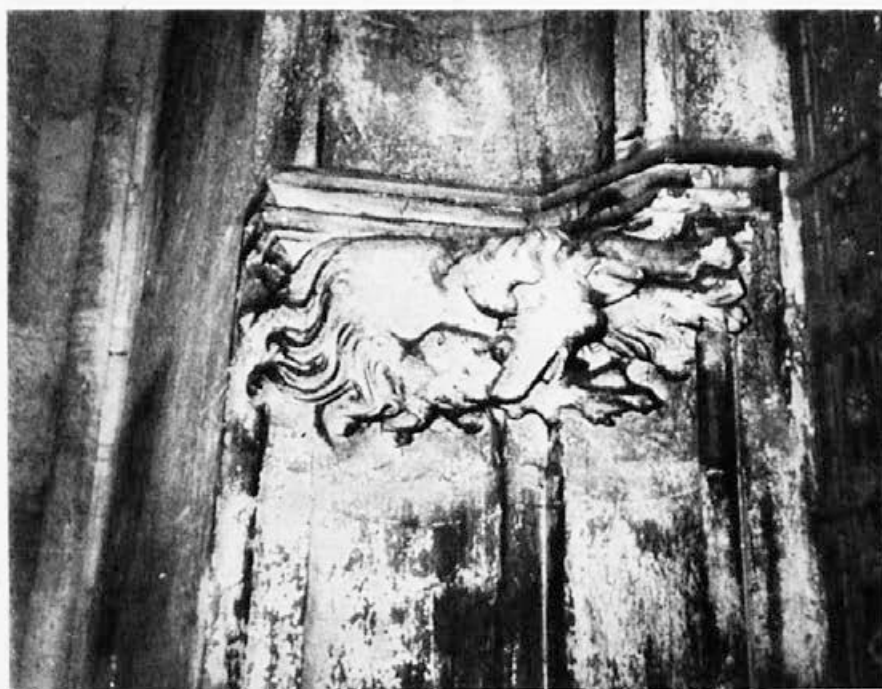
Sl. 136. Zagreb, katedrala, pas

III/c—d Grif (sl. 146) s orlovskom glavom, otvorenim (oštećenim) kljunom, u kojem je vidljiv jezičac, s malim ušesima na glavi, snažnim vratom podupire unutrašnji zid prozorskog okvira, a vanjsku stranu stražnjim dijelom tijela i nogama, od kojih je jedna s ptičjim, a druga s prstima i pandžama zvijeri. Prednja ptičja (oštećena) noga raste iz