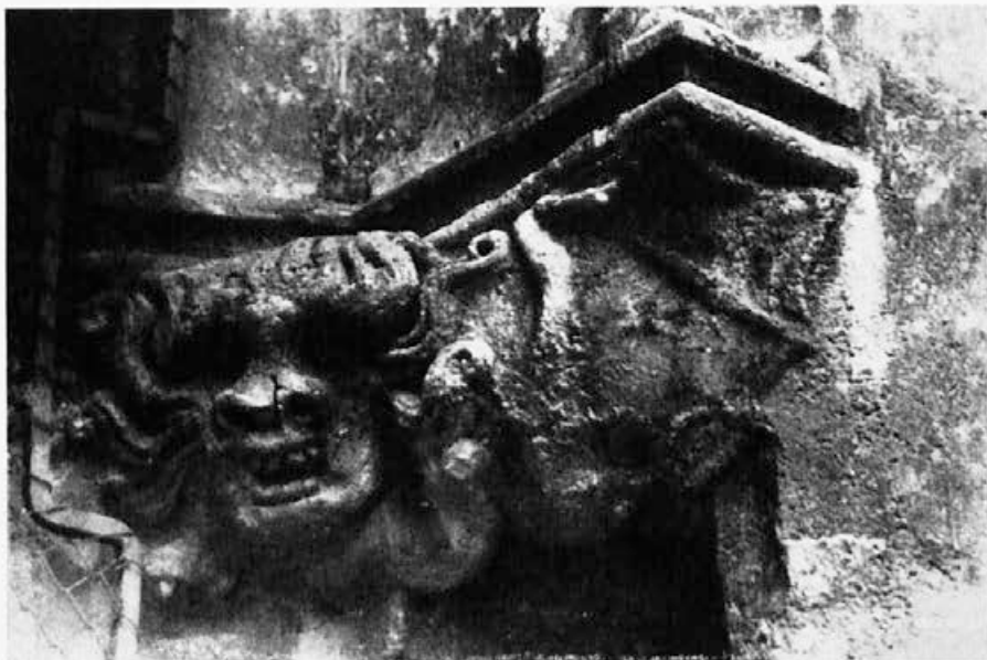
Sl. 142. Zagreb, katedrala, maska

Nedavno je pak E. Ceve upozorio na zanimljivu pojavu utjecaja Parlerovog kruga u Štajerskoj, u ptujskome kraju. 27 Tom je prilikom uočio, da taj utjecaj seže i do Zagreba, te usput spomenuo i ovu skupinu, koju ovdje obrađujem upravo na temelju pobude njegove radnje. Jedro, slikovito-plastično oblikovane maske u Hajdini i Ptuju, koje obrađuje