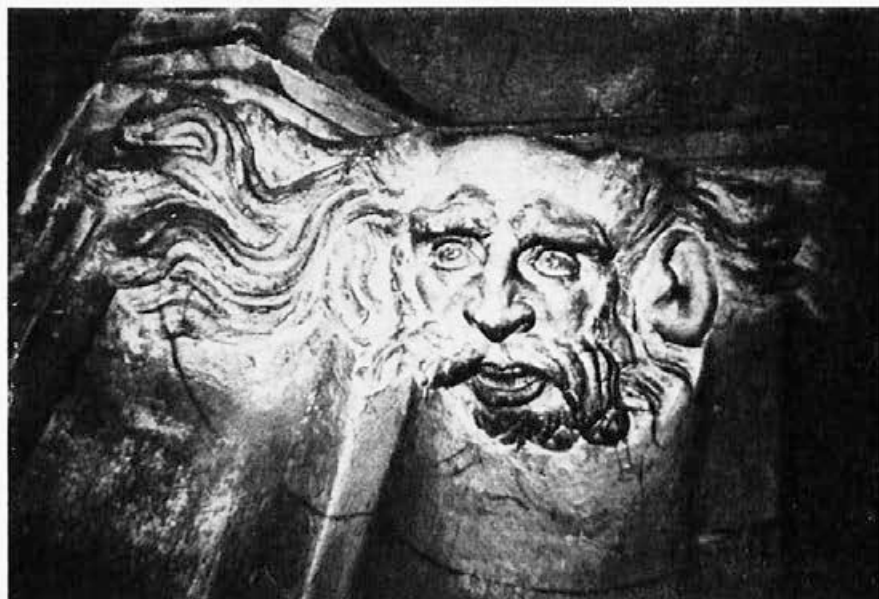
Sl. 135. Zagreb, katedrala, muška glava

IV/5 List (sl. 140) plastično izvajan, s nemirnim obodom hrastove plojke, te s žilama i plodovima, popunjuje vanjsku užljebinu prozora.