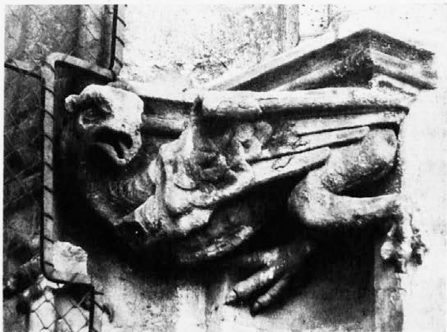
Sl. 146. Zagreb, katedrala, grif