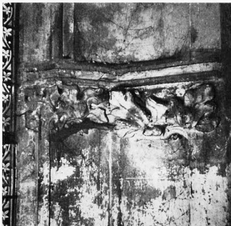
Sl. 137. Zagreb, katedrala, lišće

jakog i stiliziranog krila, koje je naglašeno horizontalnim linijama, a tek djelomično detaljnije razrađeno perje potsjeća na ljuske češera. Glava je okrenuta gotovo en face. Figura ispunja obe užljebine prozora.