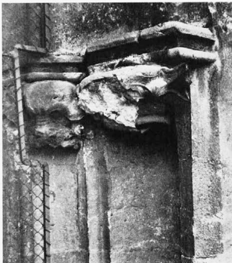
Sl. 144. Zagreb, katedrala, lišće, maska

da je jedan od vodećih majstora s pratnjom morao doći iz Parlerove radionice u Zagreb, ali tek nakon radova na tornju Karlovog mosta. Na tom su naime objektu nastala djela, koja se bliže naturalizmu, što ne potječe iz djela samoga Parlera, 28 nego iz djela, koja nadalje nastaju unutar internacionaliziranog njegovog kruga. Mogućnosti za razvoj u tom smjeru nosi u sebi plastika sv. Sigismunda, 29 no i lava podno njegovih nogu, što je prema Stixu nastalo u prvoj polovini posljednjeg decenija XIV. stoljeća. Plastično modelirano tijelo lava na Karlovom mostu, kao i meko rastresene grive dopuštaju mogućnost da zagrebački »Lave«, kao i njemu stilski srodne figure, vuku lozu od plastike s praškoga mosta, koje tumače daljnji razvoj rada Parlerove radionice. Upravo na ovim djelima javlja se novi momenat unutar ove grupe, a to je prema Stixu dramatsko psihologiziranje. 30 A taj momenat zapažamo osobito na »Muškoj glavi«. Nju bismo mogli povezati s ranijim djelima Parlerove radionice više po pojedinim detaljima, n. pr. kao od vjetra nošene kose, 31 nego po izražaju lica. Isklesana podatno, kao da pod ovom puti kola krv,