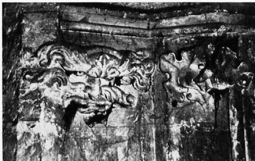
Sl. 140. Zagreb, katedrala. maska, list

Izbor motiva, koje zapažamo na zagrebačkim skulpturama poklapa se čak i u detaljima s onima u Pragu. Oni su doduše gdjekada drugačije primijenjeni, no to je samo dokaz, da se uzori ne prenašaju u cijelosti, nego da se razrađuju uvijek s novom invencijom. Evo nekoliko primjera: rast kose kao u plamenim stručkovima iz niskog čela (sl. 153, 154, 141, 145), 9 pramenovi vlasi ili griva koji svršavaju sitnim kovrčama (sl. 140, 142, 143, 147), 10 obradba perja na kreljutima, koje su naglašene gotovo ornamentalno snažnim paralelnim linijama (sl. 146), 11 list, koji raste iz korjena nosa (sl. 140), 12 jaki nadočni rubovi (sl. 153, 154), 13 lica s dubokim brazgotinama (sl. 135, 134, 141), 14 motiv ušesa u obliku šišmiševih krila, koji osim kod vraga ovdje nalazimo i na glavi jedne maske (sl. 153, 154), 15 jako naznačeni rubovi oko očiju (sl. 153, 154, 140), 16 oči u obliku oblikih puceta (sl. 148), 17 groteskne labrnje (sl. 134, 140, 141), 18 razjapljene gubice s vidljivim zubima (sl. 142, 143, 147), 19 koji se motiv kod »Muške glave«