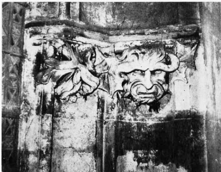
Sl. 133. Zagreb, katedrala, davalova glava, list

I/2 List (sl. 133) obrađen plastično, s označenim žilama dodiruje sotonino uho, koje je s ove strane smežurano.