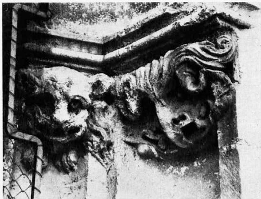
Sl. 148. Zagreb, katedrala, glava lavice, glava monstruma