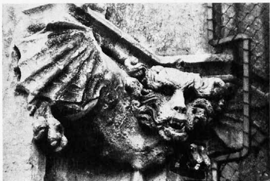
Sl. 147. Zagreb, katedrala, zmaj