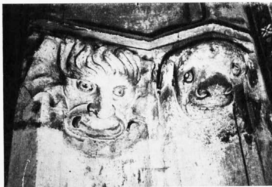
Sl. 154. Zagreb, katedrala, pasja glava, maska

IV/1—2 Lišće (sl. 159) plastično i prirodno oblikovano, s duboko urezanim plojkama kao u loze, s tu i tamo označenim žilama, s plodovima, popunjuje obe užljebine prozora.