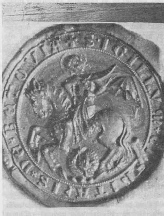
2. Pečat mesta Ptuja iz leta 1273

križem, ki se s kraki dotika stranic in brez zvezde. Težko je direktno ugotoviti, zakaj je do teh sprememb prišlo in zakaj ravno v drugi polovici 19. stol. Zdi se, kot da bi se mesto, ki se bori za svojo avtonomijo, hotelo postaviti z novim grbom. Do spremembe pride ravno v času pospešenih zavestnih akcij Nemcev in njim prijaznih Slovencev za pridobitev Spodnje Štajerske. Nemška kultura je neopazno prodirala pri raznih prireditvah, v društvih in v številnih drugih organizacijah. Grb mesta Ptuja je proti koncu stoletja dobil »novo obleko« tudi na graški deželni hiši. 1 Pri restavriranju zamenja srebrno polje ščita zeleno. Kdaj in zakaj dobi grb rumeno zvezdo, ni znano.