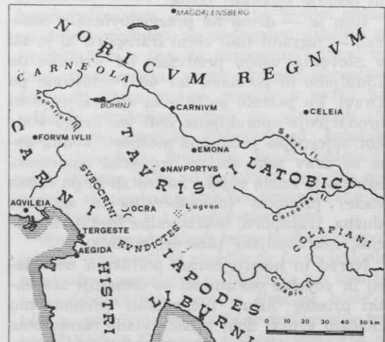
Poselitev Slovenije v keltski dobi

Rimska, navadno na keltskih poselitvenih osnovah zgrajena, samoupravna mesta na slovenskem prostoru so bila le koloniji Emona — Ljubljana in Poetovio — Ptuj (do Trajana [98—117] je bil v slednji legijski garnizon) ter municipija Celeia — Celje in Nevidunum — Drnovo pri Krškem — na etničnem prostoru še Teurnia (Sv. Peter v Lesu, nem. St. Peter im Holz pri Milštatu), Virunum , Solva (Wagna pri Lipnici), Salla (v območju mesta Zalalövö), Tergeste , Forum Iuli . Mesta so bila komunalno popolnoma opremljena. Imela so vodovod, kanalizacijo, uprav-