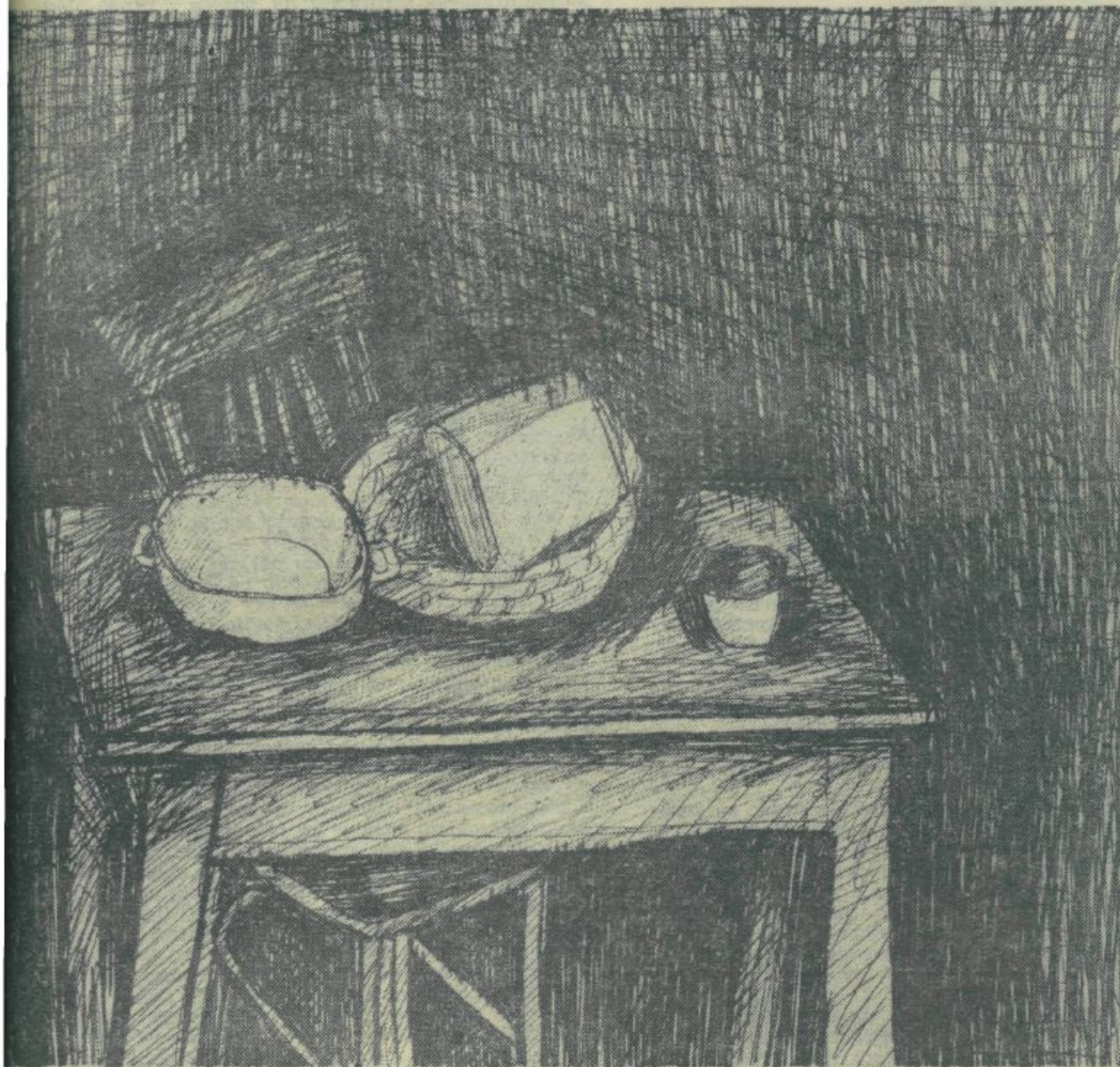
Tihožitje, jedkanica, 1966

ku občutek povezanosti z usodo drugih in odgovornosti zanjo. odvisno od tega, v koliki meri mu omogočajo da nastopa kot (zavestni) tvorec zgodovine. Ravno tako brez »smisla« je obstoj konkretne zaključene družbe, če ta ne gleda same sebe v odnosu odvisnosti in odgovornosti od zgodovine človeštva — ali od nekega »drugega sveta«. Prav tako je s samo zgodovino človeštva, če se je ne vključi ali v tok evolucije materije sploh ali pa v načrt nekega boga. Brezsmiselno je veselje samo, če je ujet samo vase. Popolnoma brez smisla pa je bog sam. Svoj smisel najde zopet le kot stvarnik veselja itd., dokler ne pridemo zopet do človeka, do ugotovitve, da ima Bog smisel le zaradi človeka.