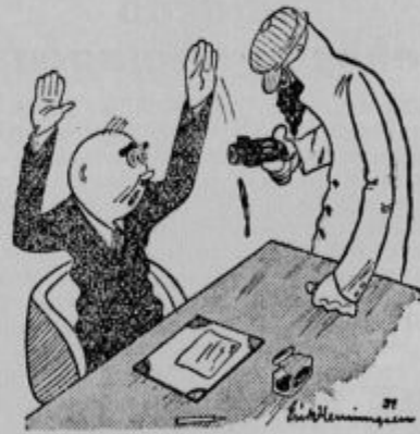
Advokat: Človek, vi ste me pa prestrašili. Misliš sem, da je policija

da so v Kaliforniji našli prvo zlato l. 1842; da dijament gori, ako je izpostavljen zadostni vročini, ker sestoji iz ogljika; da dolguje Evropa Ameriki skoraj 12 milijard dolarjev. Glavni dolžniki so Anglija, Francija, Italija in sicer dolguje Anglija nad štiri milijarde dolarjev, Francija nekaj manj, Italija nad dve milijardi, Belgija pa 400 milijonov dolarjev;