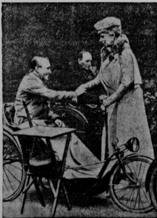
Angleška kraljica Viktorija se razgovarja z invalidom na razstavi, ki so jo priredili v Londonu v prid vojnim invalidom.