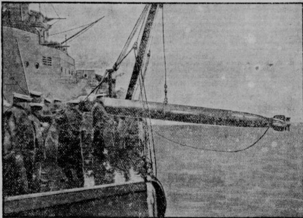
Angleška mornarica se je podala na propagandistično potovanje po angleških lukah, da bi tamkaj agitirala za novince. Mornarji razkazujejo angleški javnosti vsa čuda in skrivnosti v vojnih ladjah. Na sliki vlečejo mornarji iz morja poizkusni torpedo, ki so ga malo prej izstrelili. Pravi torpedo stane več sto funtov, zato ga pri vajah nikdar ne izstrelijo.

Nastane vprašanje, kako je mogoče, da strahen morsk pritisk ne zdrobi tako majhnih živalic v teh silnih globinah? Saj zadostuje že n. pr. pritisk nekaj sto atmosfer, da zdrobi lesene predmete! Nenavaden odpor živali v teh globinah pa pripisujejo okolnosti, da so živali same podvržene pritisku od znotraj navzven. Če te živali ujameš in jih privlečeš na površino, jim pogosto uide na dan črevesje in razpoči se jim tudi plavalni mehurček.