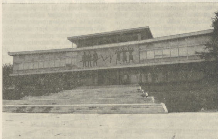
Titov muzej v Beogradu

rista, s katerim smo nato nadaljevali vožnjo do hidroelektrarne. Že od daleč je velikanški objekt dajal vtis ogromnih vrednot in velikih dosežkov dveh prijateljskih dežel. Zgrajen in svečano predan svojemu namenu je bil 16. maja 1972. leta. To lepo in častno nalogo sta opravila TITO in predsednik državnega sveta Romunije Nicolae Ceausescu.