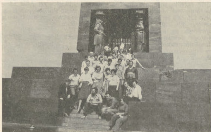
Udeleženci izleta na Avali

Sistem Djerdap, katerega proračunska vrednost je po svetovnih cenah iz leta 1962