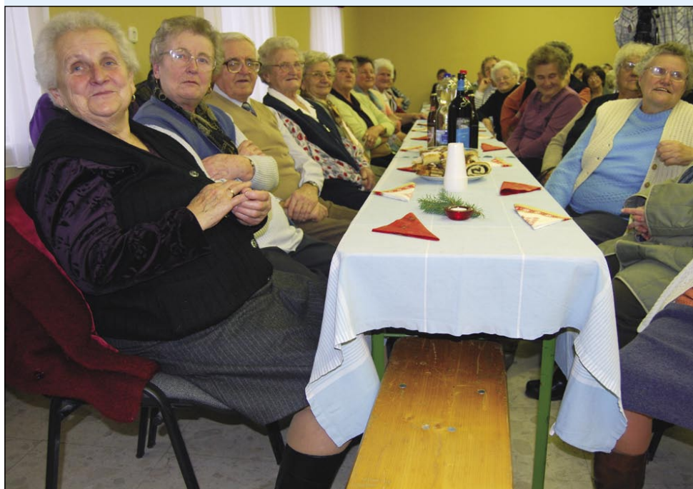
Slovenska samouprava vsakšo leto pozové starejše na predbožični program