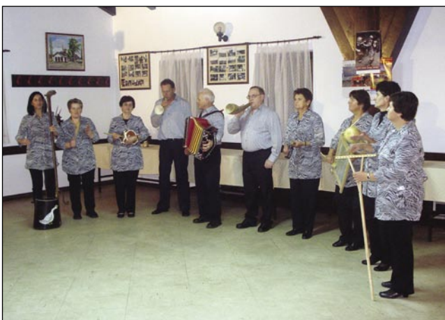
Ljudski pevci pa godci iz Satahovec