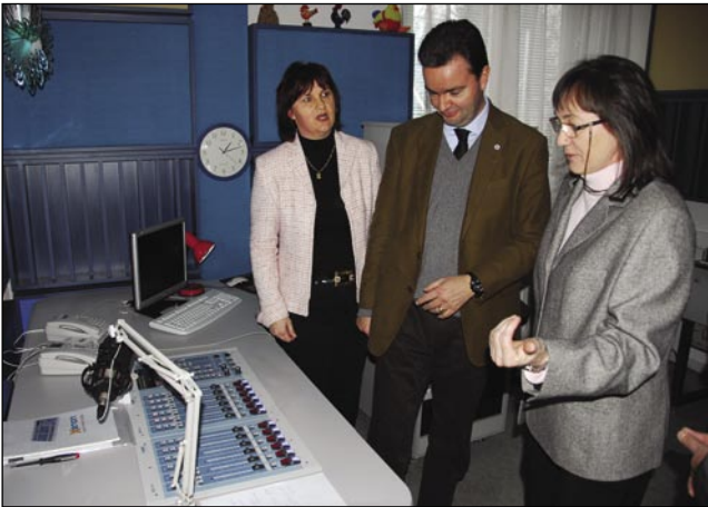
György Habsburg je delal tudi kot novinar, zato si je z zanimanjem ogledal studio slovenskega radia

slovenski Rdeči križ. Tudi naše regionalne, lokalne enote so močno povezane s kolegi na drugi strani meje. Danes je v našo organizacijo vključenih 187 držav, v muslimanskih deželah so to organizacije Rdečega polmeseca. Naši ustanovi daje izredno moč, da lahko deluje v okvirih tako obsežnega