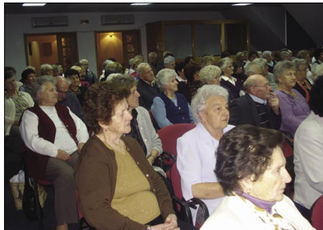
Kak lepau poslušajo svojo predsednico

veseli program s piknikom na Dolejnem Seniki. Zvöjn toga je za cejlo držjstvo valalo pozvanje Sombotelske slovenske samouprave pa držjstva na predstavitev prvoga CD-ja Sombotelski spominčic, ranč