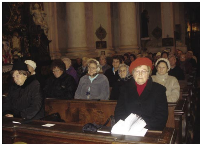
Penzionisti vsigdar radi začnejo zadnje letno srečanje s slovensko mešo

Na konci djilejša se je vsakšomi zahvalilo za vsefale pomauč,