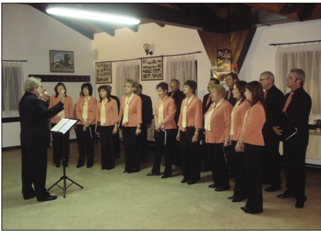
Komorni pevski zbor iz Monoštra