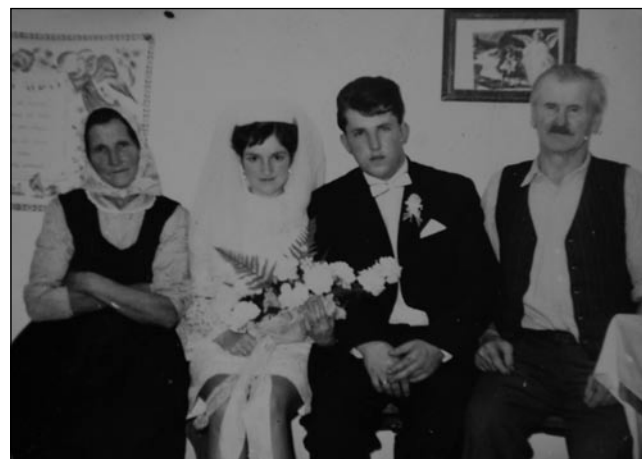
Stari oče pa mati na gostivanji strica

»Gda sem mala bila, te nej, samo osemdesettretjoga leta sem ga gorpoiskala pa sem gučala z njim. On bi mojo mater sto meti za ženo, bi go vzejo, pa naja kak mlajša tō, samo moja mati je ovak skončala. Ona je nej stejla tau, ka bi njau moj oča vzejo za ženo, ne vejm, zaka, dapa nej stejla. Bola je trpela, delala pa ona svojo življenje tak živela. Sledkar, gda je eške tadala odla na repo, tam je