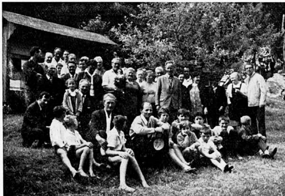
Čebelarška družina Selnica ob Dravi