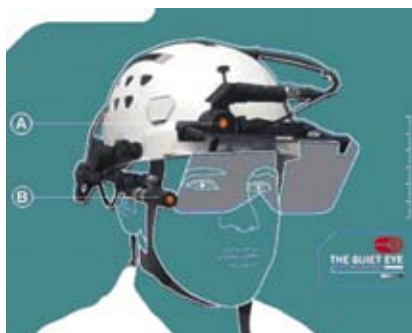
Slika 2: Tehnologija, katera nam omogoča sledenje pogleda (Vickers, 2004; Tall, 2010).