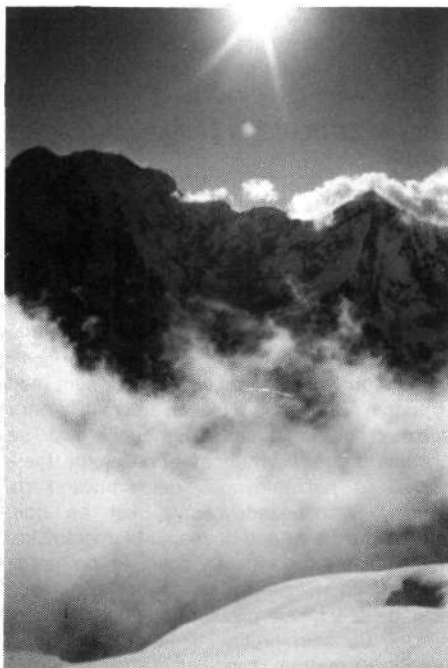
Na grebenu Šiše Pangme