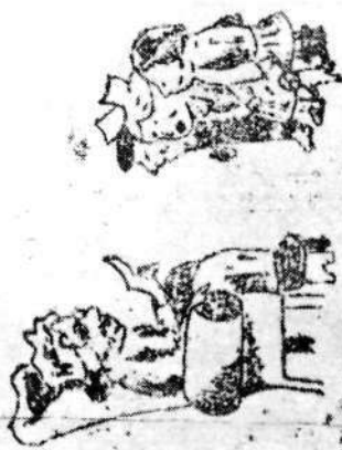
Naslovna in naslednja stran mladinske brošure, ki jo je Miloš izdelal (napisal in opremil) av- gusta 1943 na Primoževi žagi