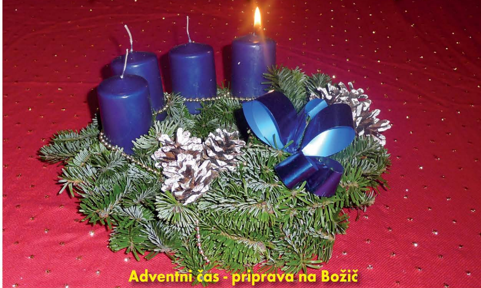
Adventni čas - priprava na Božič