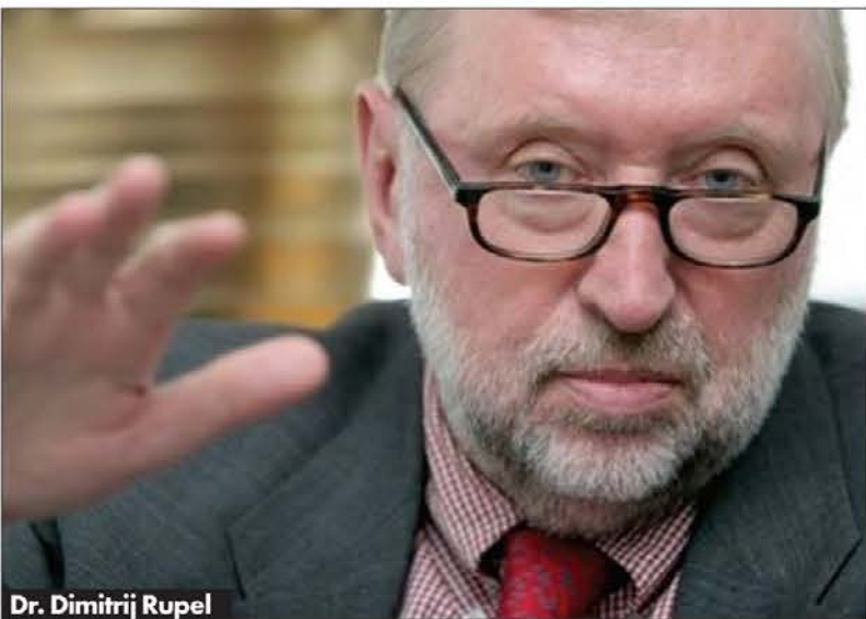
Dr. Dimitrij Rupel