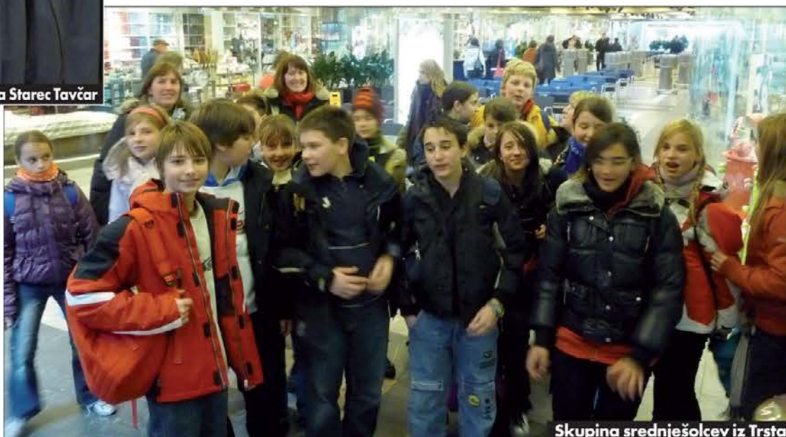
Skupina srednješolcev iz Trsta