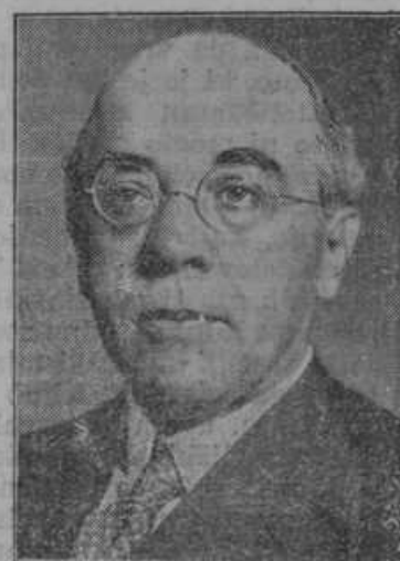
Sarraut, novi predsednik vlade.

ski predsednik Deladier je v novi vladi vojni minister. Tudi zunanje ministrstvo je obdržal Boncour. Po strankah pripadajo novi ministri skupaj z državnim podtajnikom radikalni socialistični stranki (v senatu so demokratični levičarji in sicer njih 16 po številu, 1