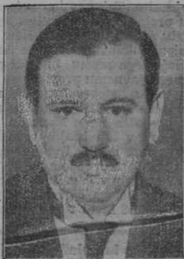
Daladier, prejšnji min. predsednik.