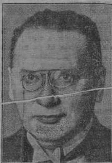
Ruski komisar za zunanje zadeve Litvinov se bo podal v Washington na pogajanja za ureditev odnošajev med sovjeti in Združenimi državami.

Za ta korak zблиžanja so bili na obeh straneh — ameriški in ruski — mero-dajni notranjepolitični in zunanjepolitični razlogi. V prvem hipu se je korak, ki ga je storil Roosevelt, dozdeval nekam čuden in zagoneten. Doslej so Zedinjene države pokazale prav malo smisla in volje, da bi se sprijaznile z boljševisko Rusijo. Napovedoval se je bojkot ruskemu blagu, češ, da je to izdelek političnih kaznjencev, da tlači cene na svetovnem trgu itd. Ako se je to odklonilno stališče sedaj spremenilo, so to odložili tehtni razlogi. Gospodarska politika, ki jo sedaj vodi vlada Zedinjenih držav, ne funkcionira gladko, temveč zadeva povsod na velike težkoče. Farmerji (poljedelci) so v posebno ostri opoziciji, ker se Rooseveltu ni posrečilo doseči povišanja cene pšenice, dočim so se cene industrijskih izdelkov povišale. Tudi v vrstah industrije se od raznih strani javlja odpor. Tem težavam naj bi odpomoglo zблиžanje z Rusijo. Že sama napoved možnosti tega zблиžanja je vzbudila v ameriški javnosti upapolno razpoloženje. Velike nade gojijo nekatere panoge industrije, da bodo v večji meri izvažale v Rusijo. Farmerje pa teši upanje, da bo vsled pomanjkanja žita in hrane v Rusiji dana možnost obilnega izvoza poljedelskih pridelkov, zlasti pšenice.