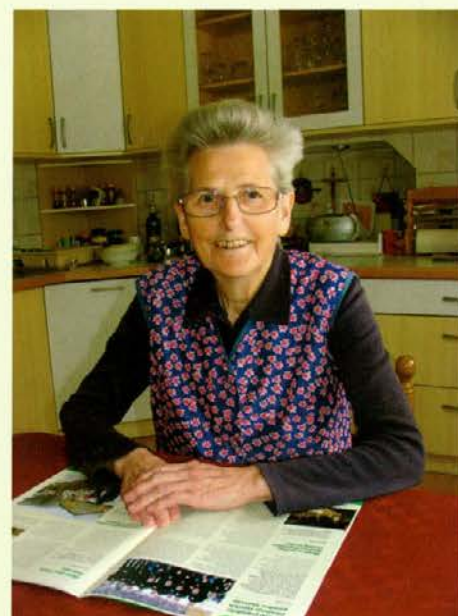
Babica Marica rada prebira Viharnik.