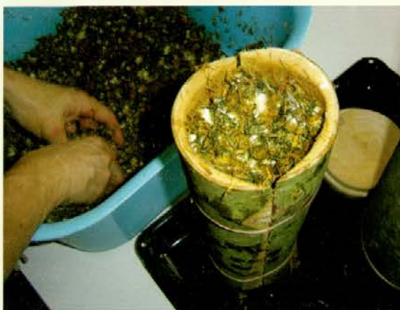
Izdelava biodinamičnih pripravkov