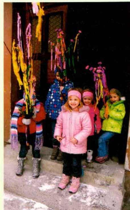
Otroško veselje na cvetno nedeljo na Razborju

Že na cvetno nedeljo je k blagoslovu snopov in zelenja prišlo veliko ljudi, predvsem veliko otrok.