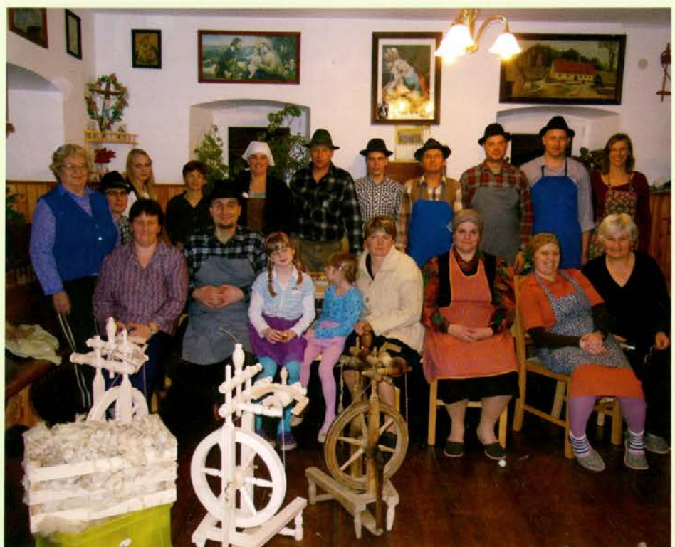
Naj bo še veliko takšnih večerov, zime pa naj nasujejo manj snega!

Med krajani so poiskali ljudi, ki se še spominjajo časov, ko so se po strminah pasle ovce. Dolgotrajen postopek predelave ostrizene volne so nekoč opravljali pozimi ob petrolejkah. In prav te izkušnje so letos starejši prenašali na mlajše in kaj hitro so dekleta in žene prav tanko nit naredile. Možje in