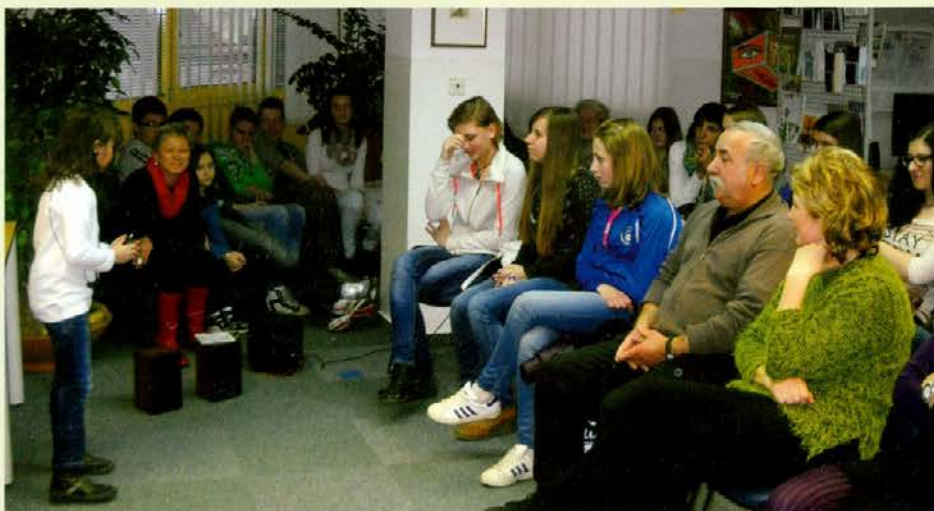
Mladi so zelo ustvarjalni.

V torek, 2. aprila 2013 ob 18. uri, se je v Knjižnici Dravograd trlo nadobudnih bralcev, pa ne kar tako. Na mednarodni dan mladinske knjige, ki ga praznujemo na rojstni dan slavnega danskega pravljicarja Hansa Cristiana Andersena, so v Občini Dravograd že drugo leto zapored obdarili zlate bralce OŠ Dravograd in OŠ Šentjanž. Letos je bilo pozlačenih kar 36 devetošolcev iz obeh šol, kar je