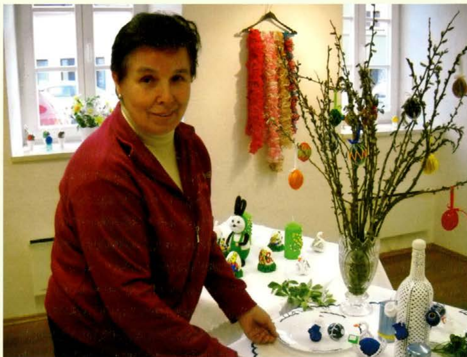
Lotka izdeluje čudovite stvari.

V pogovoru mi zaupa: "Ja letos je to že moja 29. razstava velikonočnih pirhov in