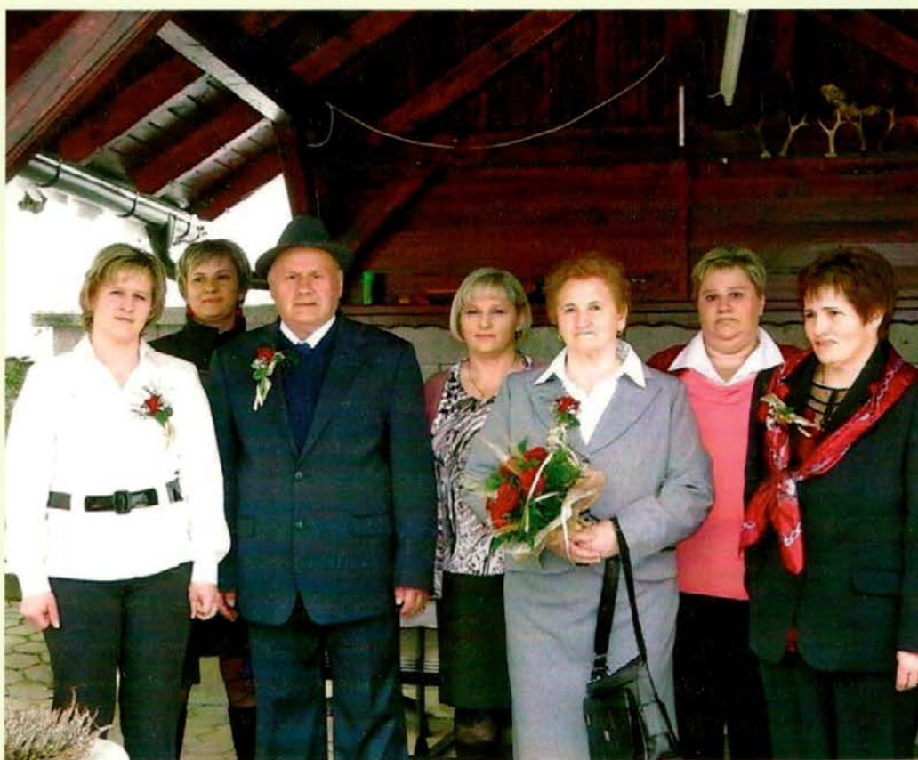
Zlatoporočenca s hčerkami

Pred slovenjgraškim županom in nato še pred slovenjgraškim duhovnikom sta obnovila svoji poročni zaobljubi, kar je bilo tako zanju kot za vse prisotne velik dogodek, saj zlato poroke ni dano praznovati vsakemu zakonskemu paru. V veselem vzdušju sta zlatoporočenca obujala spomine na leto 1963, ko sta po civilni poroki v Dravogradu in cerkveni v Pamečah že naslednji dan zaživela na Stankovem domu pri Falariču na Selah. Razmere, v katerih sta si začela ustvarjati boljše življenje, kot sta ga imela do tedaj, so bile vse prej kot dobre. Falaričeva hiša in hlev sta bila v letu 1963 dotrajana, kmetijskih strojev, s katerimi bi si lahko delo olajšala, pa ni bilo.