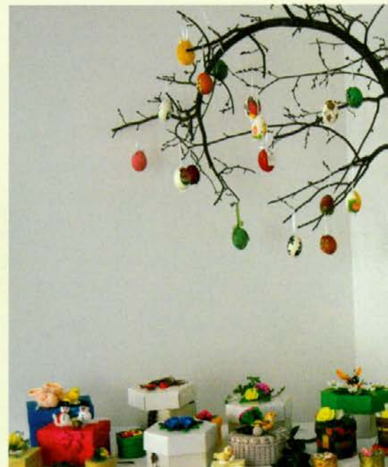
Pritegne pogled ...