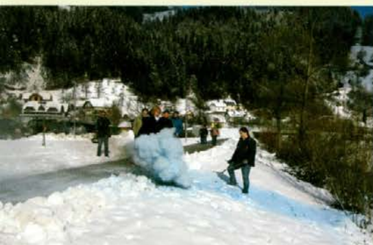
Preizkus praktičnega gašenja na usposabljanju zaposlenih OE Slovenj Gradec

Letošnji prvi pomladanski dan (21. 3. 2013) je bil, kar se cvetenja pomladanskih rož tiče, bolj zimski kot pomladanski. 21. marca smo obeležili tudi mednarodni dan gozdov. 22. marca so bili po vsem svetu pozorni na vodo, ki je marsikje primanjkuje, ta dan je namreč svetovni dan vode. Malo je držav po svetu, kot je gozdnata Slovenija, v kateri lahko pijemo vodo še iz vodovodne pipe. Za to se moramo zahvaliti prav gozdu – našemu večnamenskemu varuhu. Zato nadaljujmo s sonaravnim večnamenskimi gospodarjenjem in ne popuščajmo najrazličnejšim profitariskim pritiskom! Moje mnenje je, da voda ne sme postati privatna last! Ne pustimo se prehiteti, čas je zlato.