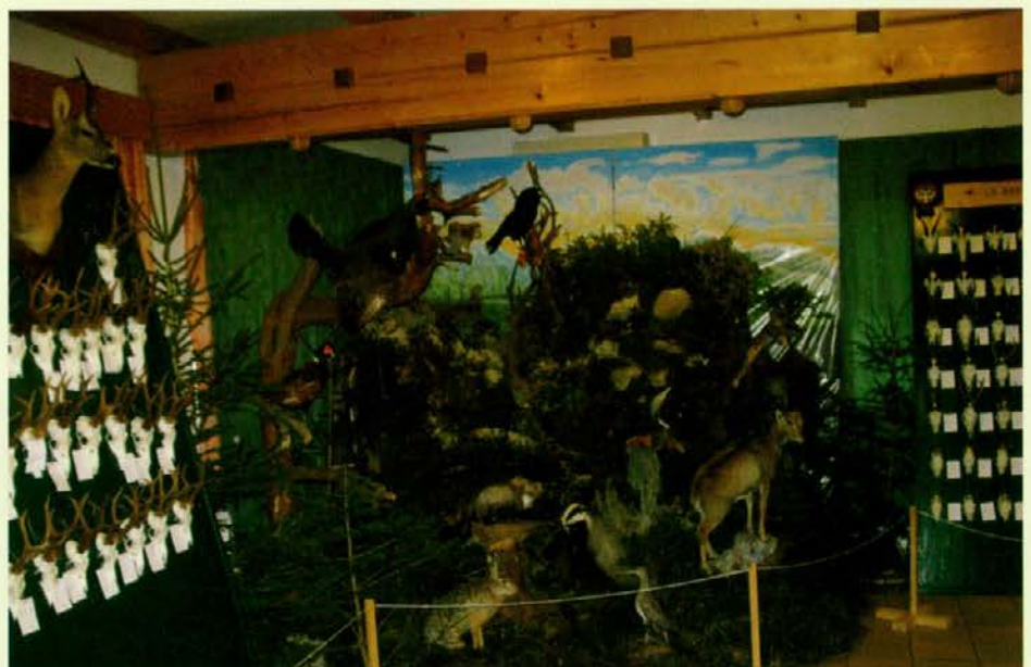
Lovska razstava pri Kovaču v Podgorju

pojavlja tudi na našem področju. Z njegovim izvajanjem so bili vsi lovci iz vseh šestih lovskih družin zelo zadovoljni in so ga z zanimanjem in odobravanjem spremljali. Poleg nas lovcev si takšne razstave ogleda tudi veliko drugih ljudi, ki s samim lovstvom nimajo kakšnih neposrednih povezav ali poznavanja. Zato je še posebej pomembno, da znamo lovci vsem obiskovalcem pravilno in strokovno obrazložiti namen lovstva, pomen razstavljenih trofej in dela naše organizacije, ki ga prostovoljno