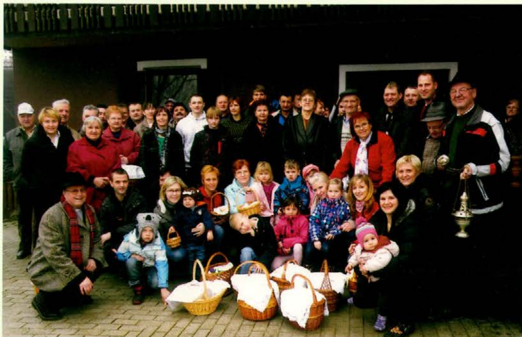
Blagoslov velikonočnih jedil pri Anžiju

podružnici Sv. Duha, ob cesti na lovsko kočo na Čerčejevem vrhu. Vsi ti obredi so kot priprava na največji krščanski praznik – veliko noč. Velika nedelja je letos kazala zelo klavrno podobo. Mraz, megla, dež. Pa vse to ni skalilo velikonočnega veselja. Celo velikonočno, vstajensko procesijo smo opravili v Podgorju. Bilo je nekaj kapelj dežja, pa smo bili malo trmasti, na koncu pa prav veseli. Po dveh mašah se je še kako prilegel velikonočni žegen. Tako smo praznovali in se veselili. Lepo je bilo. K temu opisu naših praznikov pa prilagam še nekaj fotografij, saj pravijo, da slika ne laže.