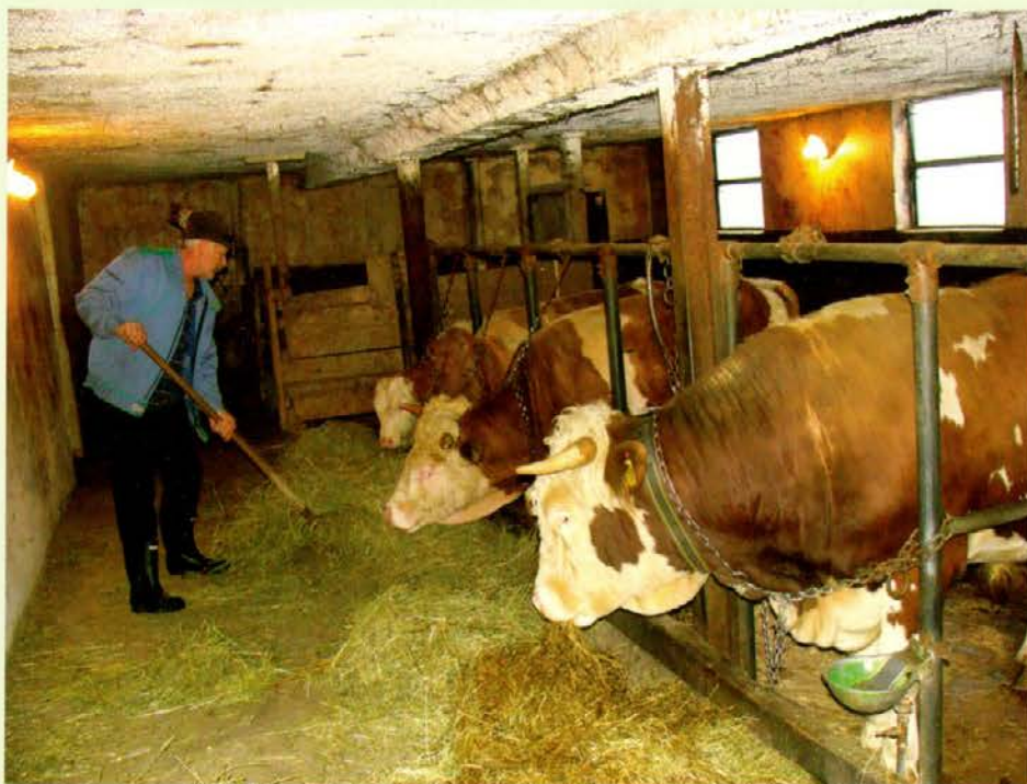
V hlevu pri govejih pitancih