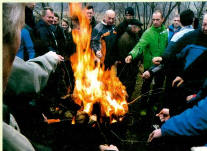
Žegnan ogenj v Podgorju

Velika sobota, ko cerkev blagoslavlja novi ogenj, pa ima še poseben čar. V Podgorju smo ta blagoslov imeli že ob 6. uri zjutraj. V nekaj minutah je bil cel kraj v dimu in vonju po blagoslovljenem ognju. Včasih so morali ti, ki so šli po ogenj, čim prej domov. Gospodinje so na tem žegnanem ognju skuhale meso za k blagoslovu. Danes je to malo drugače. Vsako uro smo imeli v župnijski cerkvi sv. Urha v Podgorju blagoslov velikonočnih jedil. Ob devetih dopoldne tudi na kmetiji Anžej v Velunji. To je ena najbolj oddaljenih kmetij in domačij, ki še spadajo v našo župnijo. Zbere se veliko ljudi in lepo sodelujejo pri obredu blagoslova. Opoldne je bil blagoslov še v