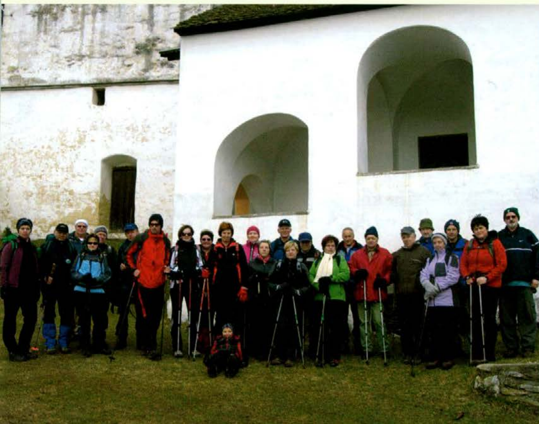
Pred pohodom na Rahtel

v širšem evropskem prostoru. Prevezla me je njena lepa notranjščina, še posebej pa mogočni rimski marmorni podporni steber, ki je bil izklesan iz enega samega kosa skale. Gospa nam je pokazala tudi prostor, kjer so leta 2001 odkrili kostnico. To se je zgodilo čisto po naključju, ko je v klet padel delavec, ki je opravljal obnovitvena dela. Pozneje sem slišal, da so sem grajski zapirali svoje podložnike, ki so tu našli svoj konec. Pot smo nadaljevali mimo cerkve svete Radegunde do ceste, ki iz Starega trga vodi v eno smer na Sele in v drugo v Slovenj Gradec. Predsednico društva sem ob koncu vprašal, koliko ur smo hodili. Odgovorila je, da nekaj minut dlje kot tri ure. Jaz pa sem hudomušno dejal: "Podaljšamo svoj pohod, da bo trajal okoli štiri ure!" Seveda sem se samo šalil, saj sem imel tudi že vsega dovolj.