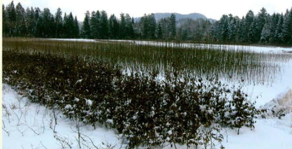
Drevesnica Omorika na Muti pod snegom (27. 3. 2013)

Zakonsko določilo o prometni varnosti dovoljuje 15. marca menjavo zimskih gum. Letos so jih ta dan menjali najbolj pogumni šoferji, terenski šoferji jih bomo menjali v aprilu. V višjih legah je v času nastajanja informativnih storžev še veliko snega.