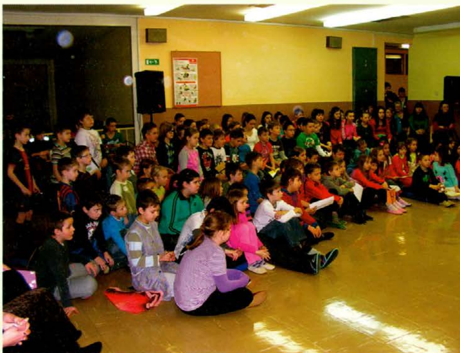
Udeleženci letošnjega otroškega parlamenta v OŠ Brezno-Podvelka

Na otoškem parlamentu v OŠ Brezno-Podvelka, ki ga je organizirala mentorica šolske skupnosti Tanja Blaznik Cvetko, so sodelovali učenci vseh razredov. Učenci prvega razreda so pokazali, kako se lahko marsikaj naučijo z igro, učenci drugega razreda pa so predstavili pomembne osebe v svojem življenju. O prijateljih in prijateljstvu so spregovorili tretješolci, o računalniku in medmrežju pa so razmišljali učenci četrtega, petega in šestega razreda. O ljubezni so spregovorili sedmošolci in pri tem poudarili: "Če se dva človeka ljubita in če hočeta, da ljubezen ostane, morata izbrati isto smer v življenju. Šele ko bosta hodila po isti poti, si bosta vedno bližje in njuna ljubezen bo ostala." Na zabaven in nazoren način so osmošolci pokazali razlike med starši danes in starši v