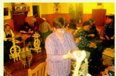
Tako kot nekoč ...

fantje so cufali in krtačili volno. Potem so prejo cvrnali, tako kot so to nekoč delali njihovi predniki, in kaj kmalu so nastale štrene. Ker je zima mrzla, so letos prišle prav pletene nogavice iz domače volne. Ob prepevanju ljudskih pesmi so bili večeri druženja ob kmečki peči prav prijetni. Ugotavljali so, da le vaja dela mojstre in da niso pogrešali televizije.