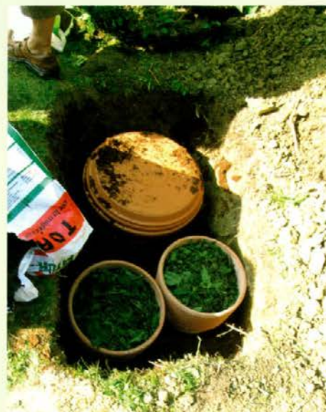
Skrbno shranjevanje pripravkov