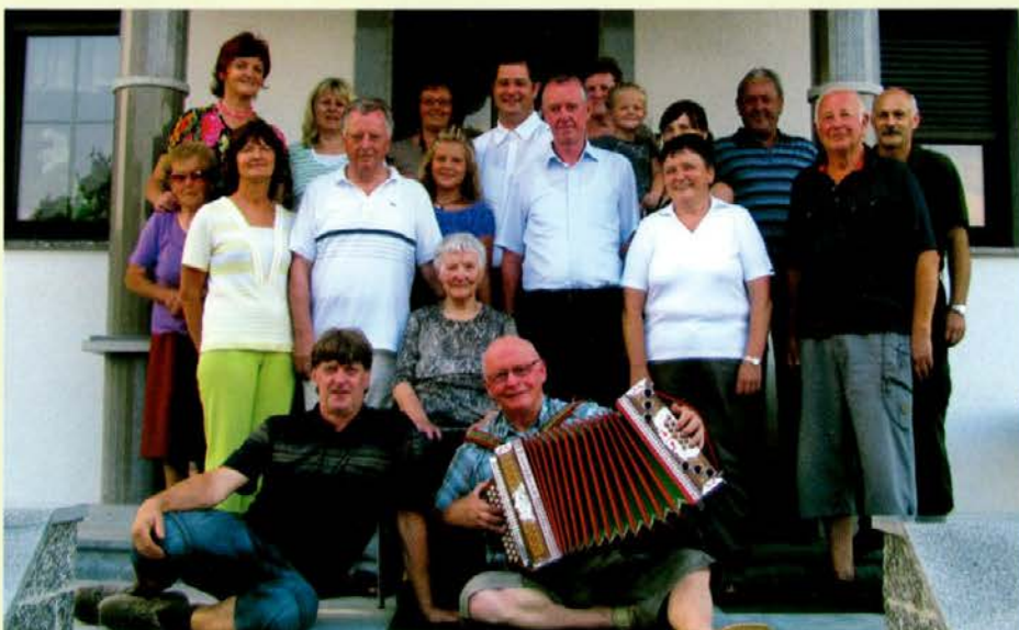
S slavljenko Elizabeto