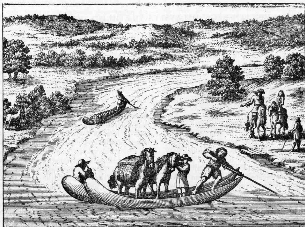
J. Koch. o.

Še dosti bolj zgovorne so glede naših kmečkih domačij novejša zemljiške knjige , ki zajemajo čas od 1870 dalje. Ker hrani zemljiške knjige vsako sodišče, so zelo lahko dostopne tudi na podeželju. Če smo lahko zasledovali na osnovi matičnih knjig genealogijo posameznih družin, pa menjavanje lastnikov na posameznih domačijah, nam omogoča zemljiška knjiga podroben vpogled v vzroke, zakaj so prevzemali novi lastniki določena posestva. Zemljiška knjiga nam bo razložila, ali gre pri menjavanju gospodarjev le za navadno dedovanje, ali pa so bile spremembe zaradi gospodarskih zadreg in kriz. Kmetija je bila mogoče prezadolžena, pa jo je lastnik prostovoljno prodal, ali so jo pa upniki gnali na dražbo. Mogoče bomo ugotovili, da so bila nekatera naselja v določenih področjih v določenem času močno pod takim vplivom, druge kriza ni prihajala toliko do izraza. Skušali bomo ugotoviti, kje so vzroki za tak pojav. Mogoče nam bo dala taka analiza toliko pobud, da bomo segli še po starejših zemljiških knjigah, ki potekajo iz konca XVIII. stol., in bomo skušali pritegniti še ustrezne urbarje. S tem bo dobila slika o posestnih