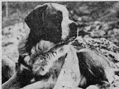
PES BERNARDINSKE PASME, KAKRŠNE DRESIRAJO AVGUŠTINSKI REDOVNIKI ZA REŠEVANJE IZ SNEGA. V PREJSNEM STOLETJU JE TAKŠEN PES Z IMENOM BARRY REŠIL PREKO 40 OSEB

Seveda ni bilo v vseh samostanih tako idealno kakor ob ustanovitvi. Ščasoma je redovna disciplina popustila in predvsem v 16. stoletju so ob reformaciji skoraj vsi samostani zašli v krizo. Kjer so imeli samosta-