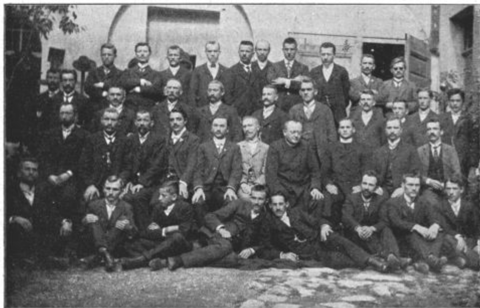
Udeležniki koralnega tečaja v Mariboru l. 1907.