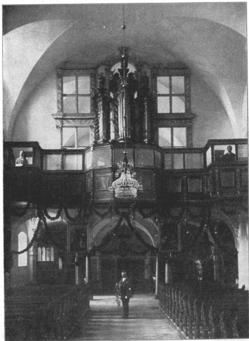
Orgle in pevski kor v Mekinjah pri Kamniku. Orgle iz l. 1720.