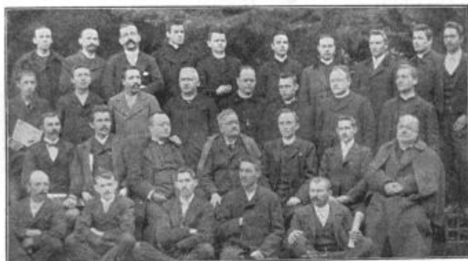
Udeležniki koralnega tečaja v Gorici l. 1906.