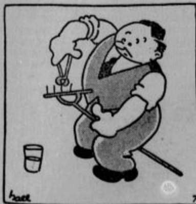
Zobni zdravnik popravlja grablje na svojem vrtu.

Iz Washingtona poročajo, da je vodstvo ameriškega Rdečega križa poslalo vsem katoliškim škofom v Združenih državah opravičilo radi neke sramotilne slike, ki je proti volji osrednjega vodstva šla v liste ameriškega Rdečega križa. Vodstvo Rdečega križa, v katerem je tudi mnogo katoličanov, med temi tudi škofje sami, je priobčilo javno izjavo, ki pravi, da je treba dogodek z omenjeno sliko pripisati nemarnosti nekaterih podrejenih organizacij in da nima ameriški Rdeči križ prav nič proti katoliški cerkvi.