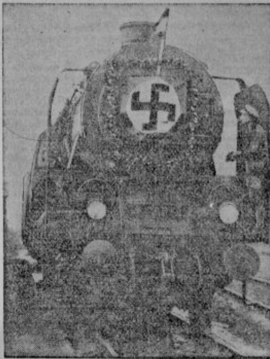
Železniški stroji v Italiji nosijo fašistično sekuro, v Nemčiji pa Hitlerjev kljukasti križec.