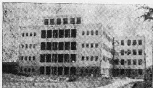
Severna stran III. drž. real. gimn. v Ljubljani.

Filozof Platon je rekel, da so vse, kar je velikega na svetu, izvršili mladi ljudje. V mladem človeku je odločnost, je požrtvovalnost, je podjetnost, je živo stremljenje in želja, delati za svoj narod, za njegovo veličino in srečo, za njegovo rast in slavo. Tudi v vas, dragi dijaki, gori plamen, ali vsaj tli iskra ljubezni do naroda in države. Mnogi od vas že gradite načrte, kaj boste velikega in korisnega storili za svoj narod. Eden od vas gleda morda sebe v bodočnosti kot velikega pisatelja, drugi kot državnika, tretji kot vzornega duhovnika; četrti želi na sebi pokazati, kakšen bi moral po njegovi zamisli biti idealen profesor; zopet drugi gradi v mislih železnice in ceste in mostove, ali uravnava naše reke in hudournike... Mi vsi starejši vam želimo uspeha v bodočnosti in bomo srečni, če se izkaže, da je nemara danes kdo med vami, ki bo svojčas dostojno stopil ob stran morda tudi Prešernu, tudi Slomšku, tudi Miklošiču. A to je bodočnost — kaj pa morate v ta namen storiti že sedaj? Ne morete storiti kaj lepšega, kakor če težite za tem z vsem svojim srcem in se trudite z vso močjo svoje volje, da se usposobite za resnične duševne delavce. Poudarek leži tu na besedi delavec. Ni lepšega naslova na svetu, nego če si kdo more upravičeno prisvajati naslov „delavec“. Ta naslov je častitejši nego so bili plemiški atributi. Kdo je delavec? Delavec, vreden svojega imena, je tisti, ki v