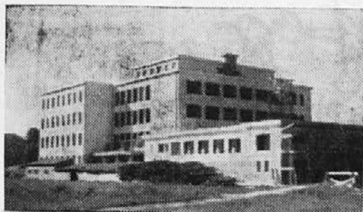
Pročelje, južna stran, III. drž. real. gimn. v Ljubljani.

Hvaležnost je največja izobrazba. Vi, dragi dijaki, se boste izkazali slovenskemu narodu hvaležne s tem, da se boste na vso moč trudili, da bo v tem jasnem gradu prišlo obilno svetlobe v vaše glave in obilno toplote v vaša srca.