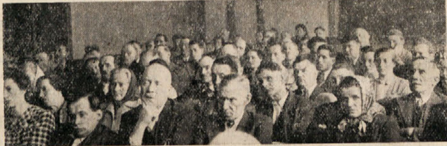
Zbrani zastopniki izseljenjskih družin so na letnem občnem zboru Zveze slovenskih izseljencev z zanimanjem sledili izvajanjem govornikov