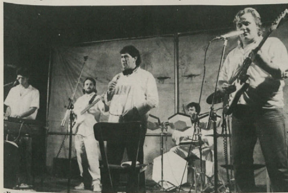
«Kraški bratje» so uspešno nastopili v Nabrežini.

»Vtoroe hudoženstveno« Mosfilma je naredilo odlično predstavo, ki jo je lahko razumeti na obilo načinov. Podtonov je kolikor jih gledalec sam sliši. Rusija in pozneje Sovjetska zveza se je vedno zapletala v čudne vojne. Razen druge, v kateri je bila napadena, se je ta ogromna država zapletala v čudna zavezništva, vojne, kjer je izgubljala svoje za veliko ozemlje redko prebivalstvo. Tako je končno tudi sedaj, v Afganistanu. Le zakaj Sovjetska zveza ne pove, koliko vojakov je izgubila v tej oddaljeni deželi?