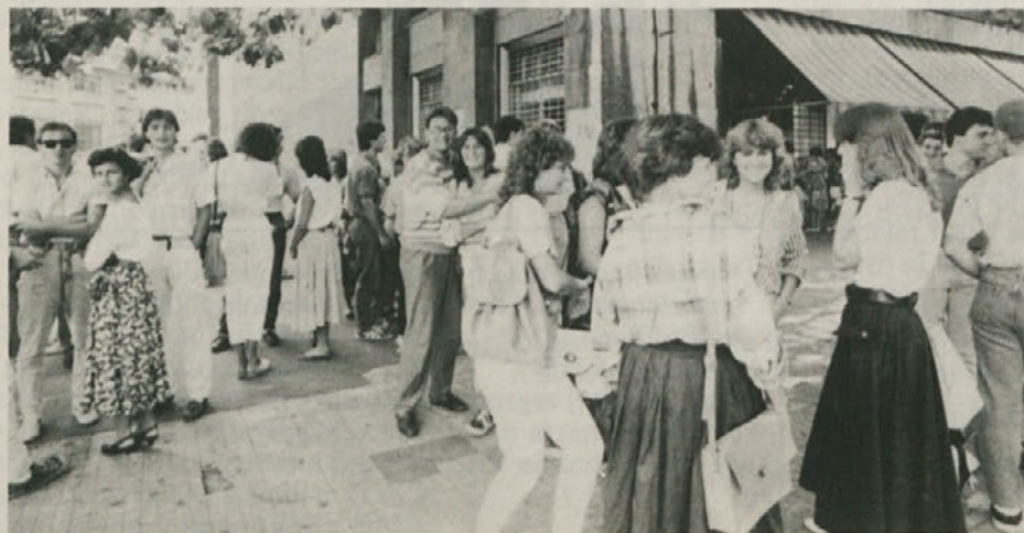
Z začetkom šolskega leta je tudi na trgu Oberdan vse bolj živo.

Film je pol dokumentaren, pol igran. Gledalca prepričajo prizori ruskih vojakov, ki jih granate raztreščijo pred