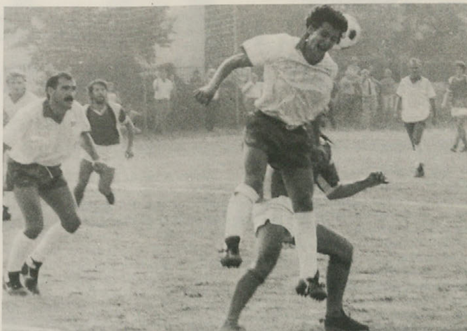
Žačela so se nogometna prvenstva. Na sliki prizor iz tekme Vesna-Kras.

Rasputin je bil največja skaza človeka, ki se je izognil vojaštvu, ko so njegovi rojaki padali kot snopje. Blagoslov pa je izrabil. Lahko si je izbral dobesečno vsako od takrat številnih žensk, ki so imele fante in može na fronti, same so imele v Petrogradu in na deželi niso imele